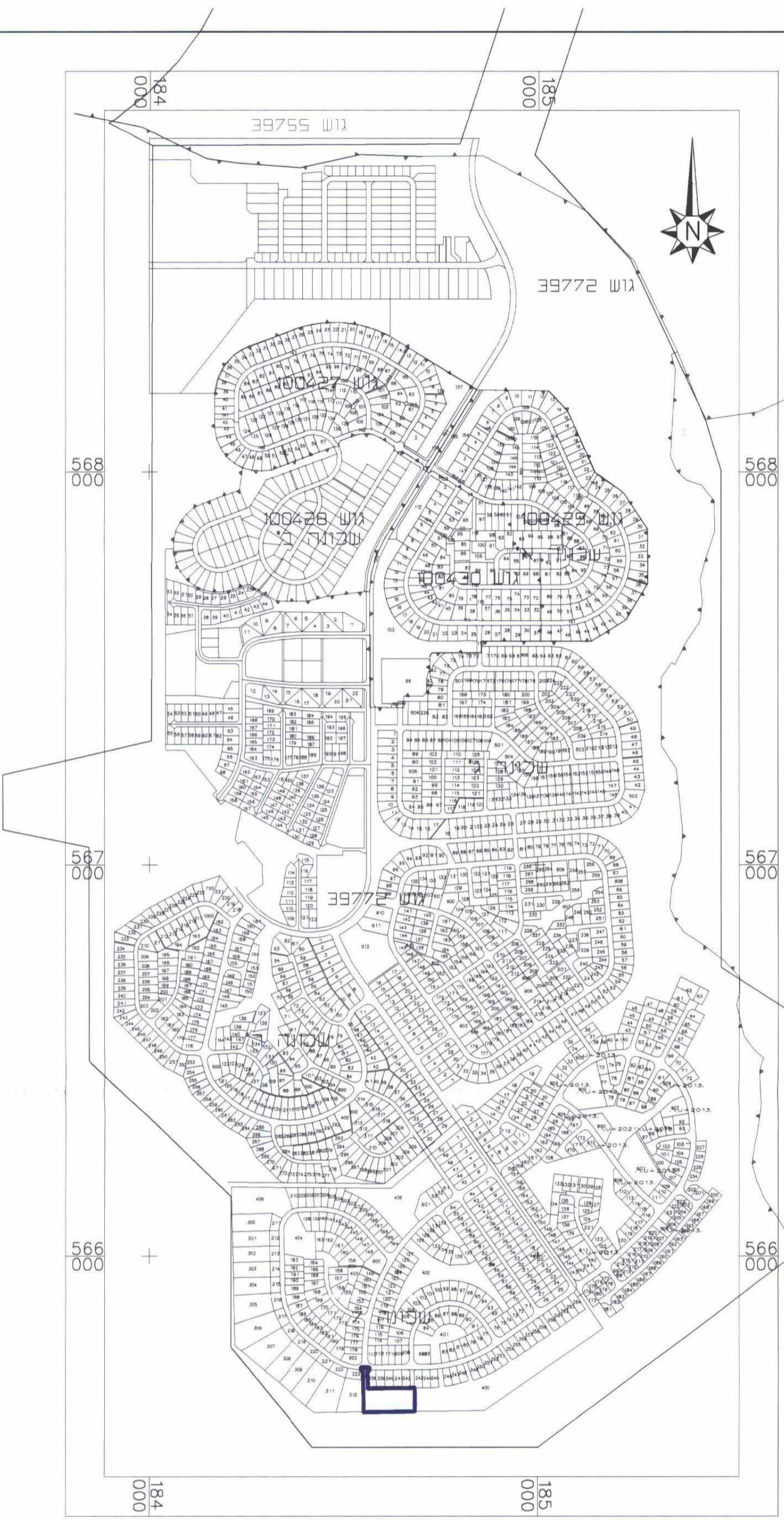
תנ"שים הסביבה ק.מ. 1:10000

מרחב תכנון מקומי שמעוטם תכנית מפורטת מס. 450/03/7 שינוי לתכנית מס. 193/במ/7 שגב שלום שכ. 7