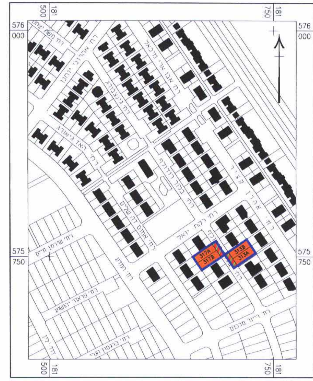
תרשים סביבה 1:2500

בובליק ג'אנה (לאה) מוד: 07/שטחית מר. 1110 טל: 0545237835 מודד מוסמך: הודעה על אישור תכנית מס' 36/203/03/5 בעל הקרקע: 5663 ליפובצקי נטליה אדריכלית מס' רשיון 104717