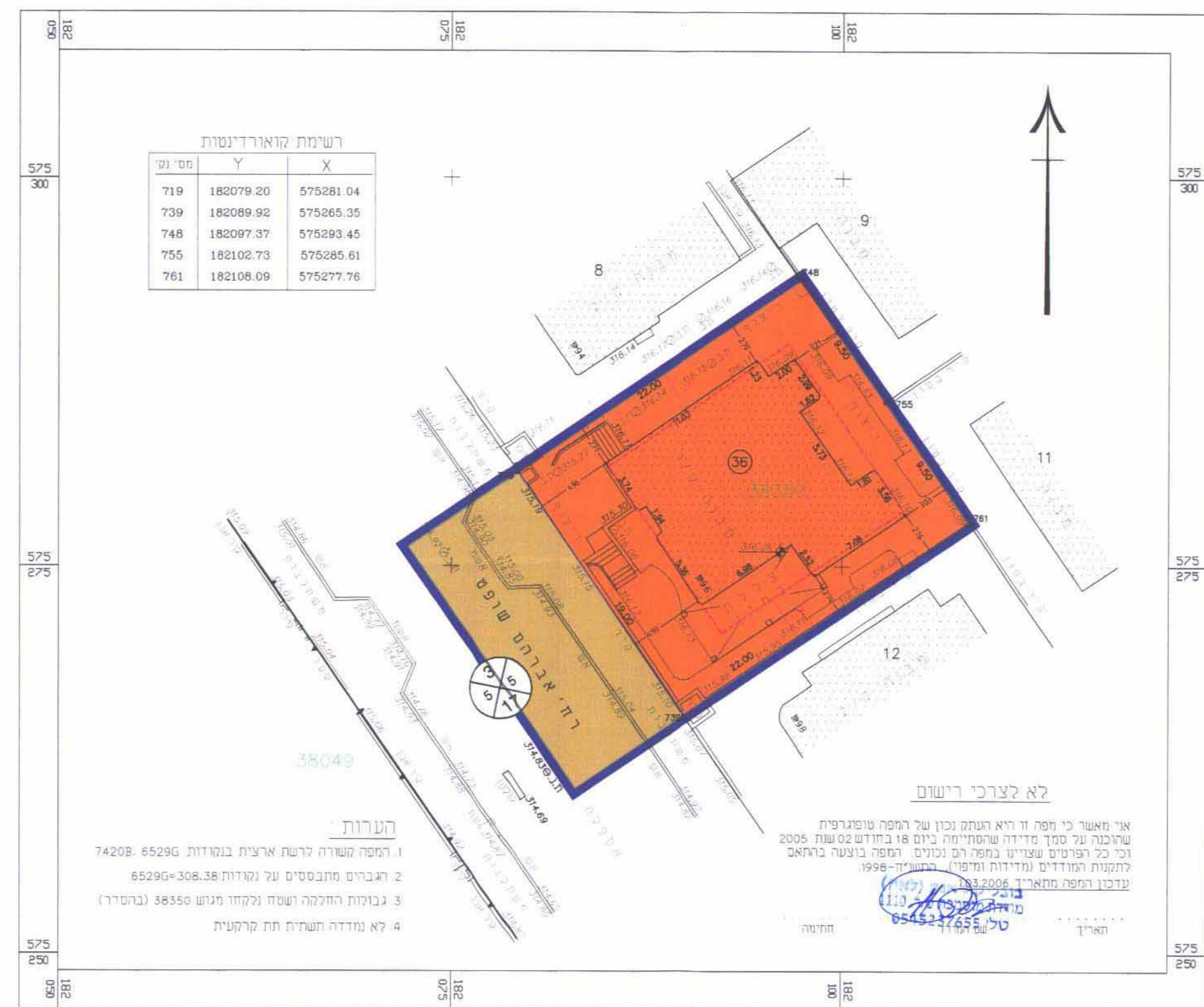
מצב מאושר קני"מ 1:250