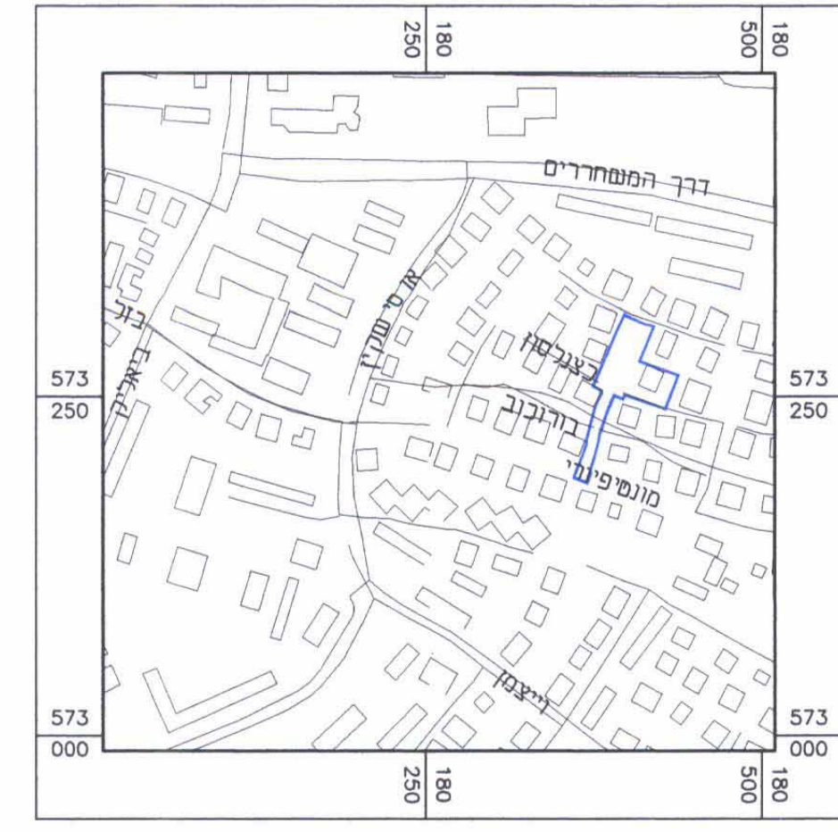
תרשים סביבה קנ"מ 1:5000