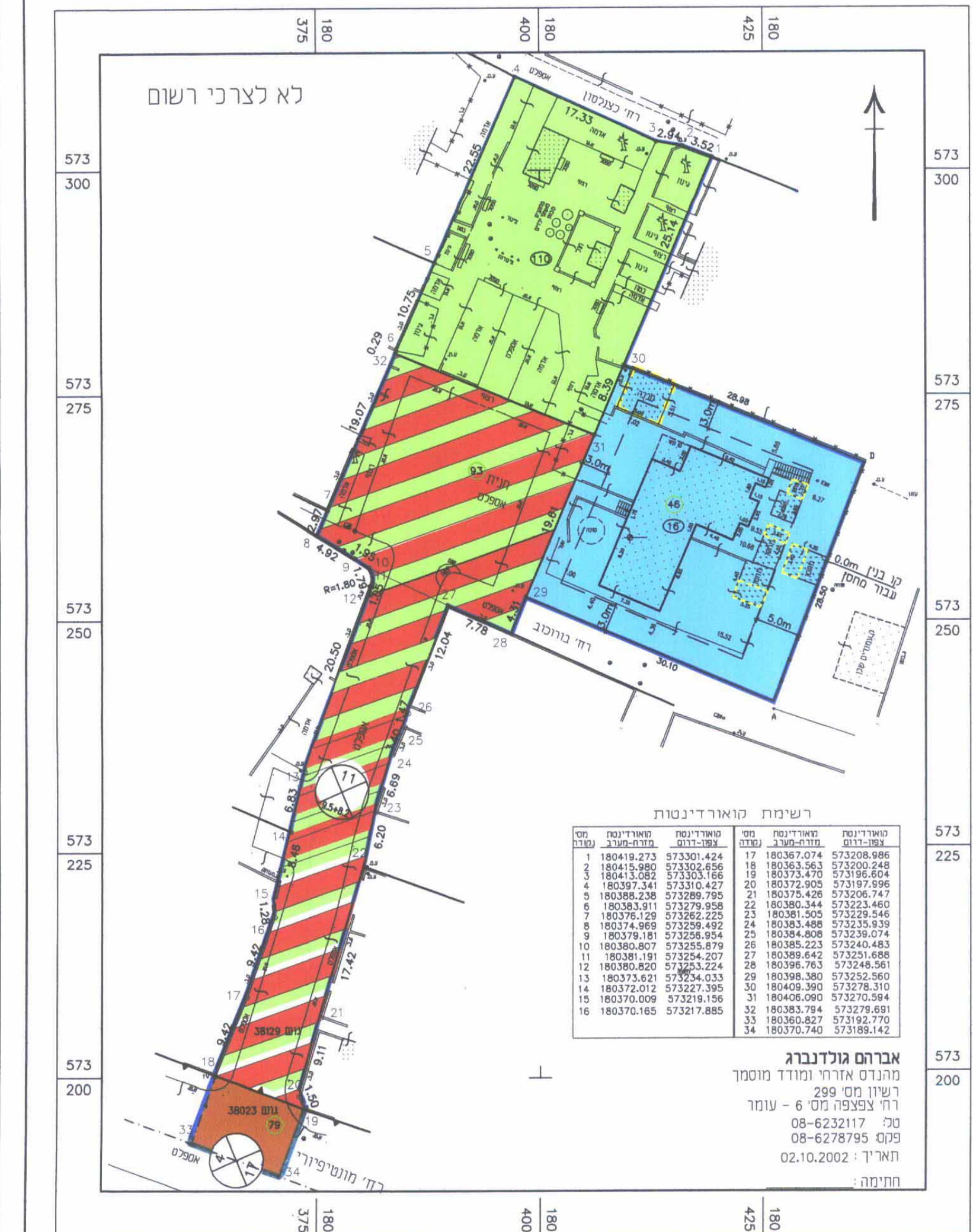
מצב מוצע קנ"מ 1:500

אברהם גולדנברג מהנדס אזרחי ומודד מוסמך רשיון מס' 299 - עומר רח' צפצפה מס' 6 - עומר טל: 08-6232117 פקס: 08-6278795 תאריך: 02.10.2002 חתימה: