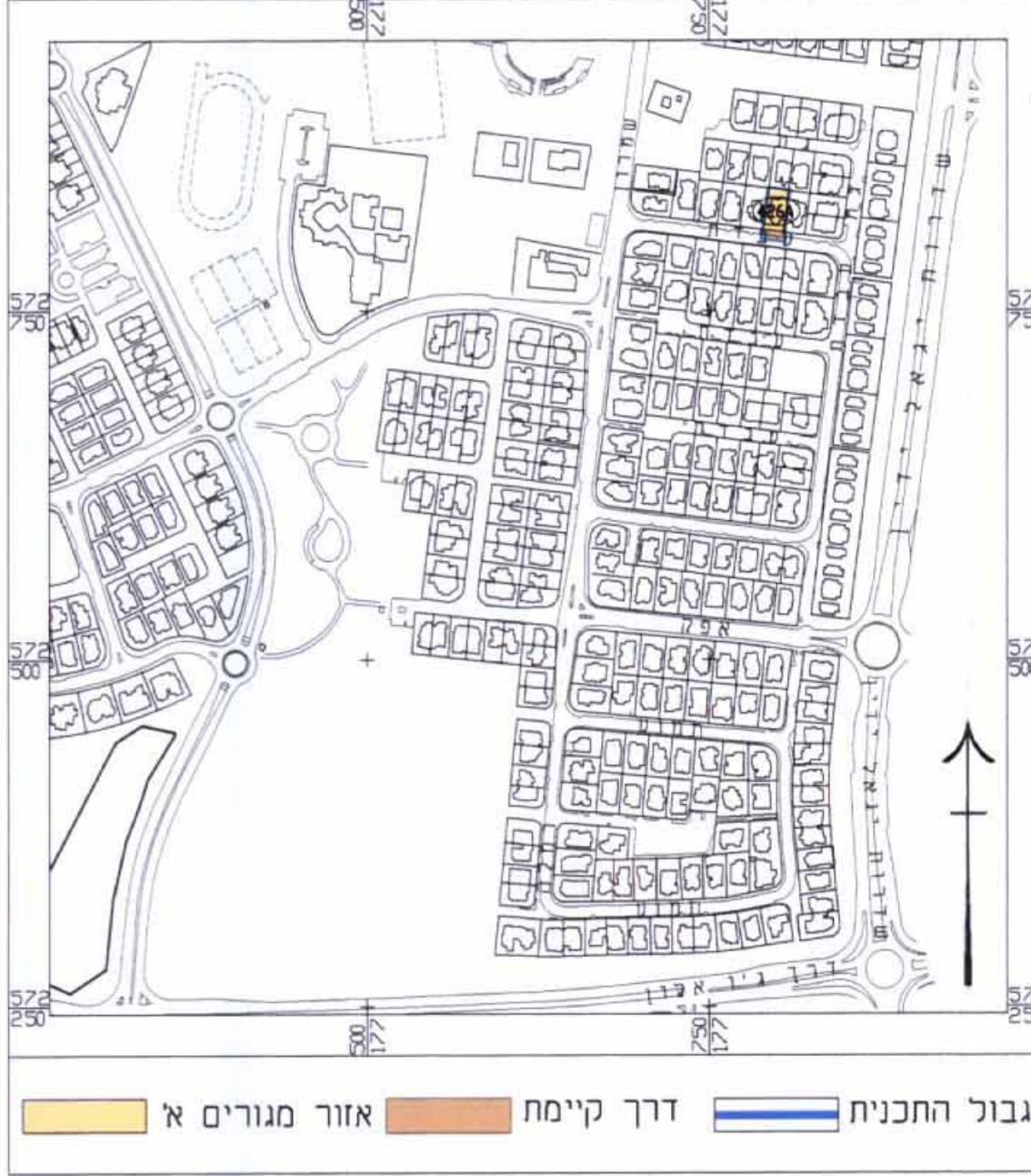
תרשים הסביבה קנייה 5000 : 1

חתימת עורך התכנית אדרי רבינוביץ ויקסור ת.פ. 1035367 רח' עבדת 12, ב"ש