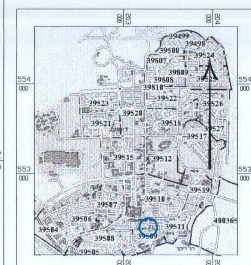
תרשים סביבה כללי 1:25000