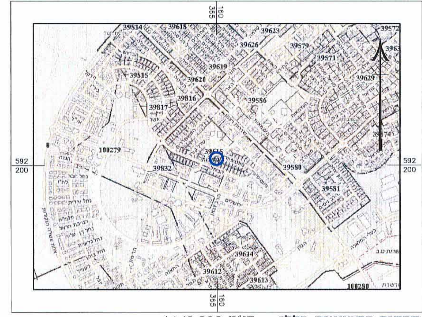
תרשים התמצאות כללי קנ"מ 1 : 10,000