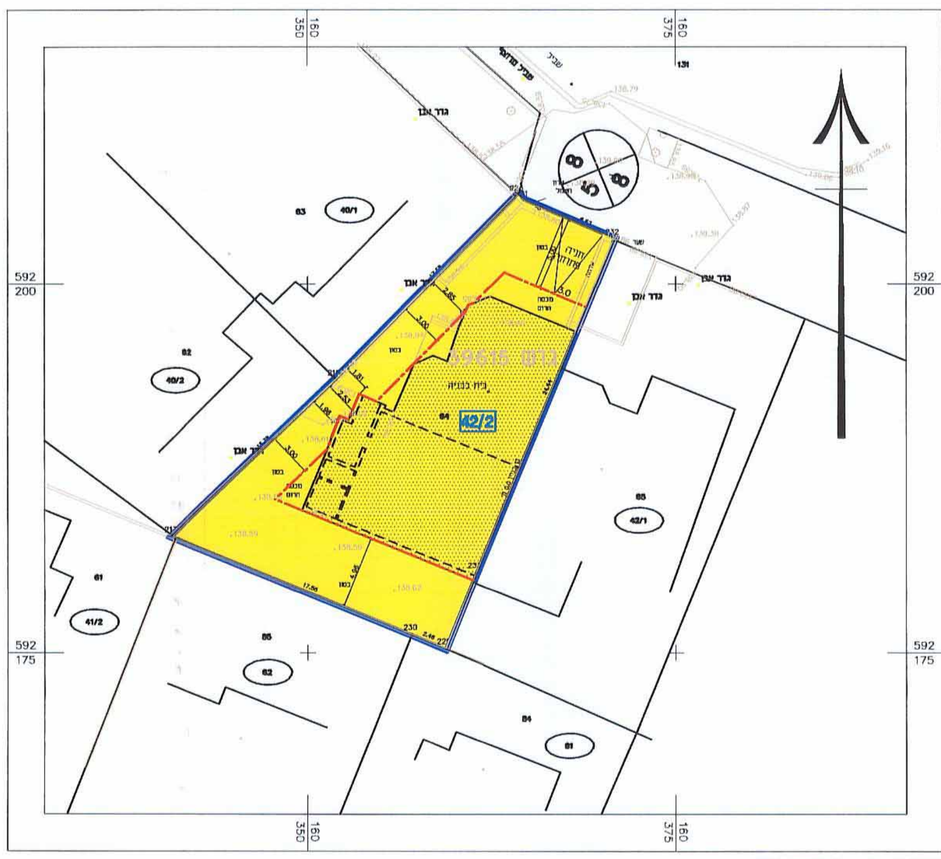
מצב מוצע קנ"מ 1 : 250