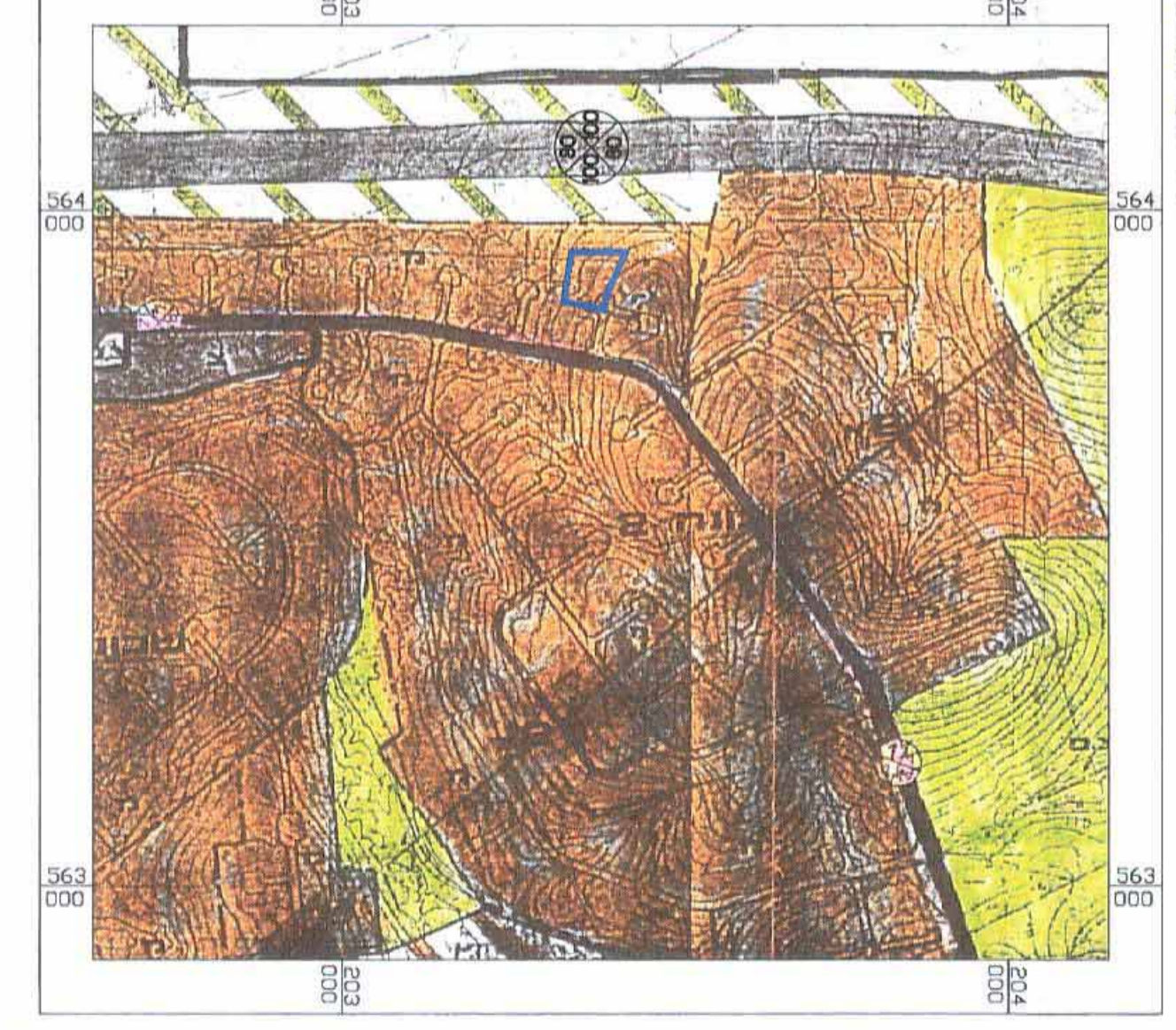
תרשים סביבה עפ"י תכנית מתאר מסי 7\03\11\30