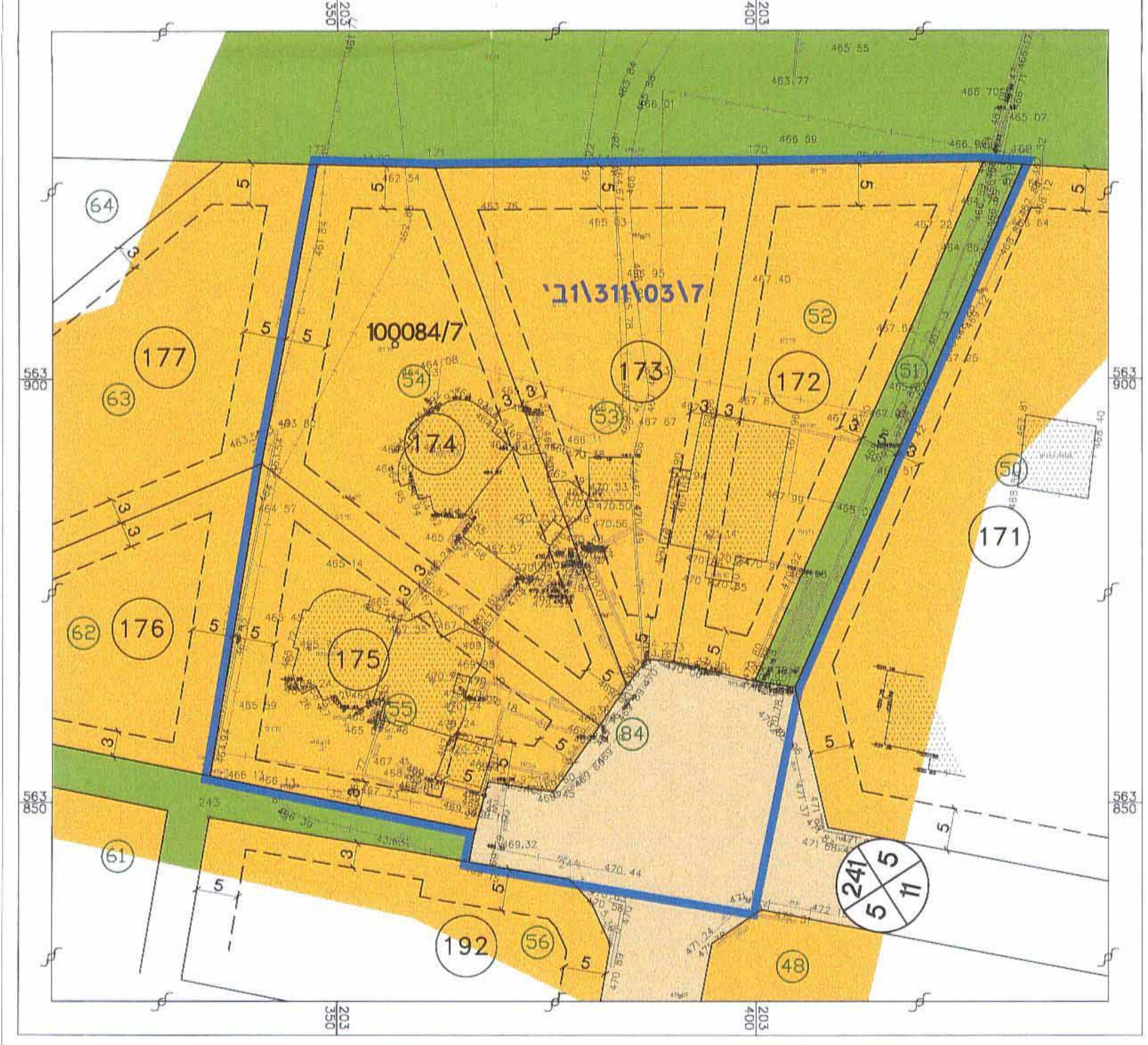
מצב מאושר ק.מ. 1:500