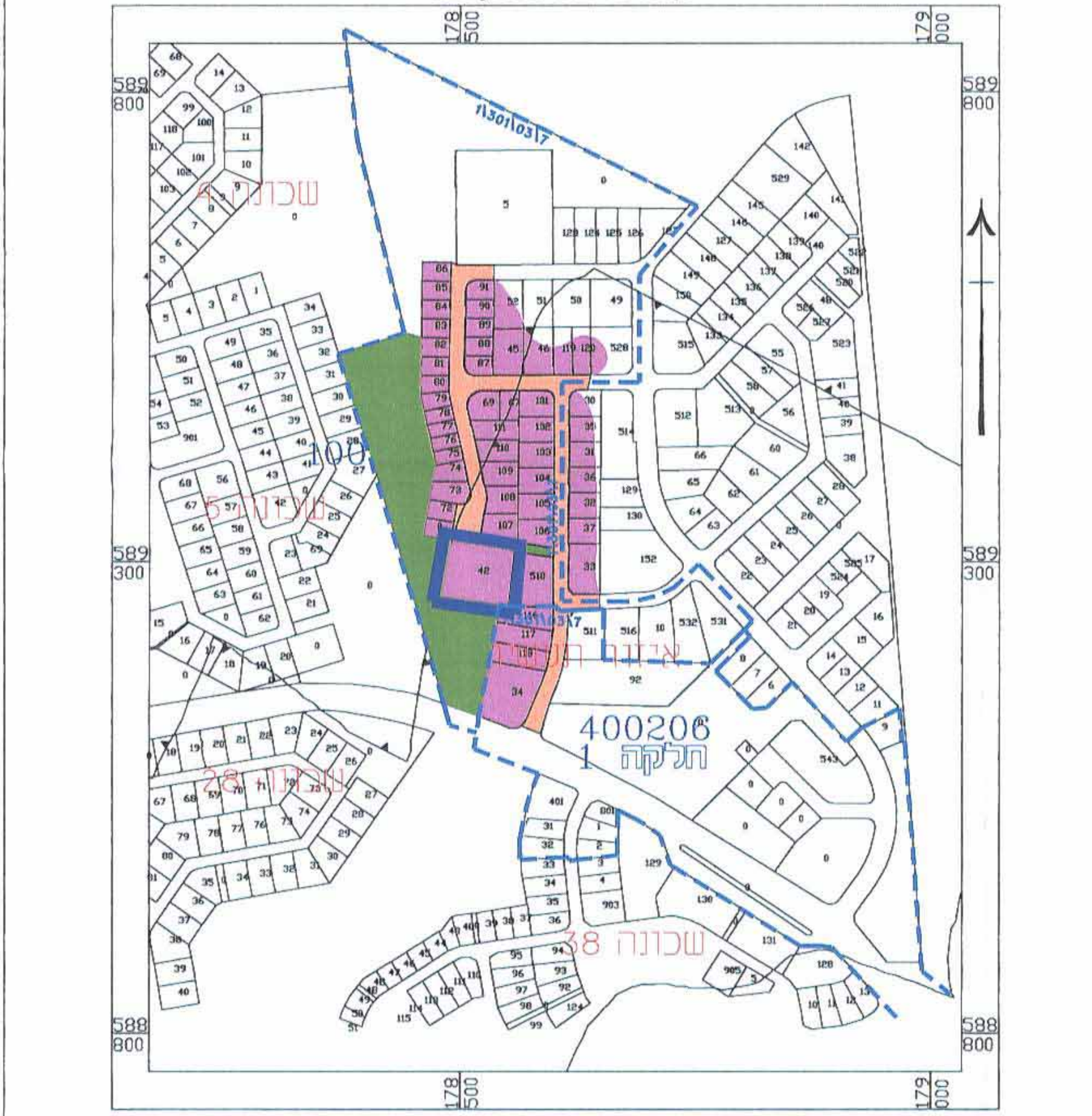
תרשים סביבה קרובה - אזור מלאכה ותעשייה, רהט ע"פ תוכנית מאושרת קנה מידה 1:2,500

הצהרת המודד הרני מצויר בזאת כי מדידת המפה הטופוגרפית המהווה רקע לתוכנית זו, נערכה ע"י ביום 15.08.2012 והיא הכנה לפי הנוראות נוהל מבאית ובהתאם לנוראות החוק ולתקנות המודדים שבתוקף. דיוק הגודל הכחול והקדסטר: מדידה אנליטית לפי ברמת תציר (כולל הקו הכחול). אבו ג'אמע זוהדי 792 מספר רישיון שם המודד