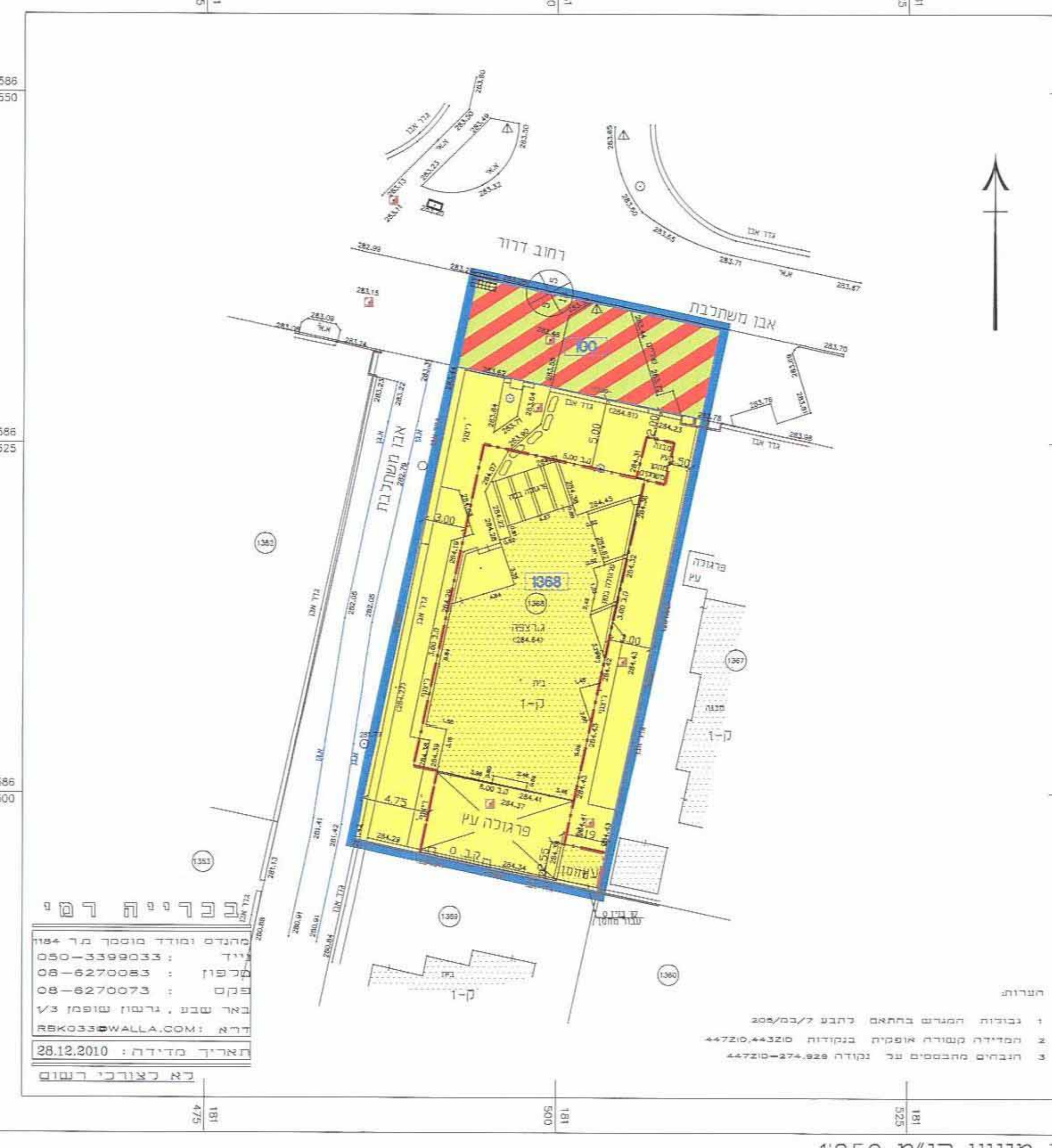
מצב מוצע קנ"מ 1:250

הערות: 1. גבולות המגרש בתחום רחוב 7/במ/305 2. המידות הנשירות אינן סופיות בנוסחיה 44320/4720 3. הבהרים מתבססים על נוסחה 274.928/44720 מנהל מטרמיני ישראל מס' רישון 19.03 חתימה 30.04.13