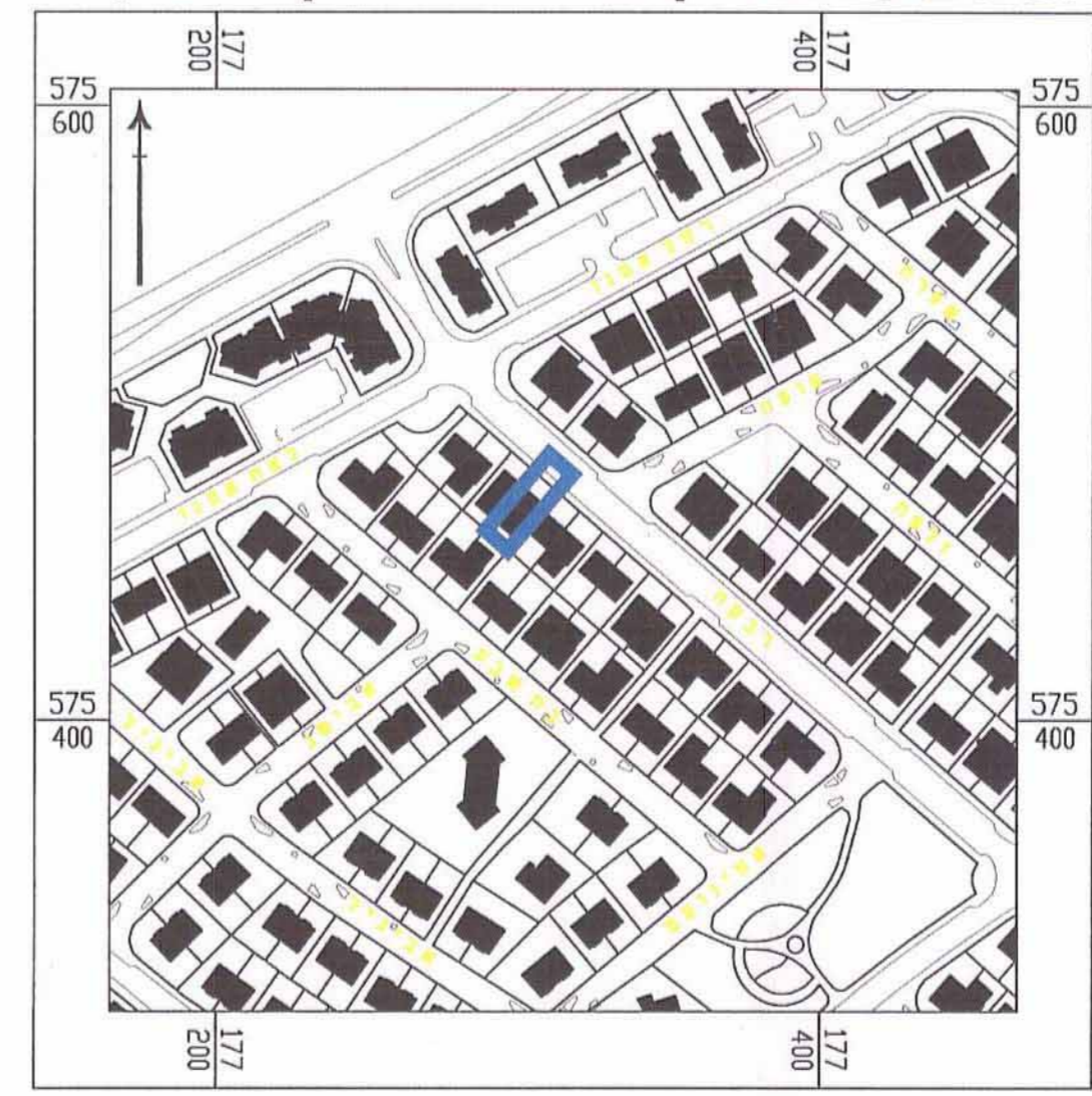
תרשים סביבה הקרובה קני"מ 1:2,500