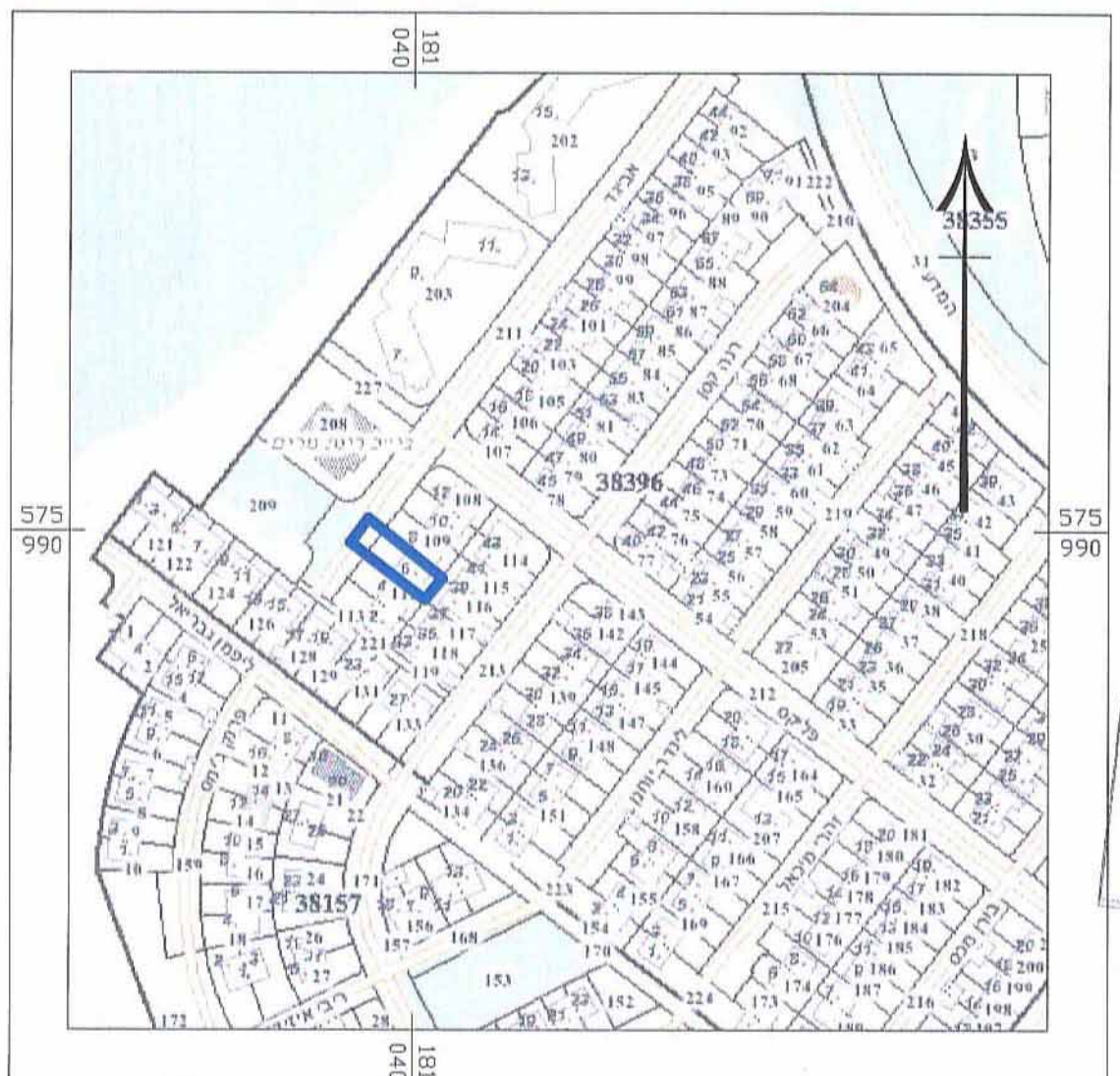
תרשים סביבה קרובה קנ"מ 1:2,500