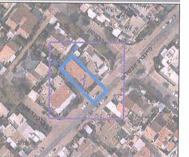
שנת צילום אוויר: 2012/2014 גרסה מעריכה 02.2012

* כמפורט בהוראות / הודעה תרשים התמצאות 1:1500