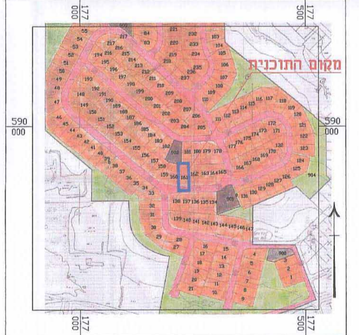
תרשים סביבה קרובה-שכונה 2, רהט על רקע תכנית מתאר (389/03/7) קנה מידה - 1:5,000