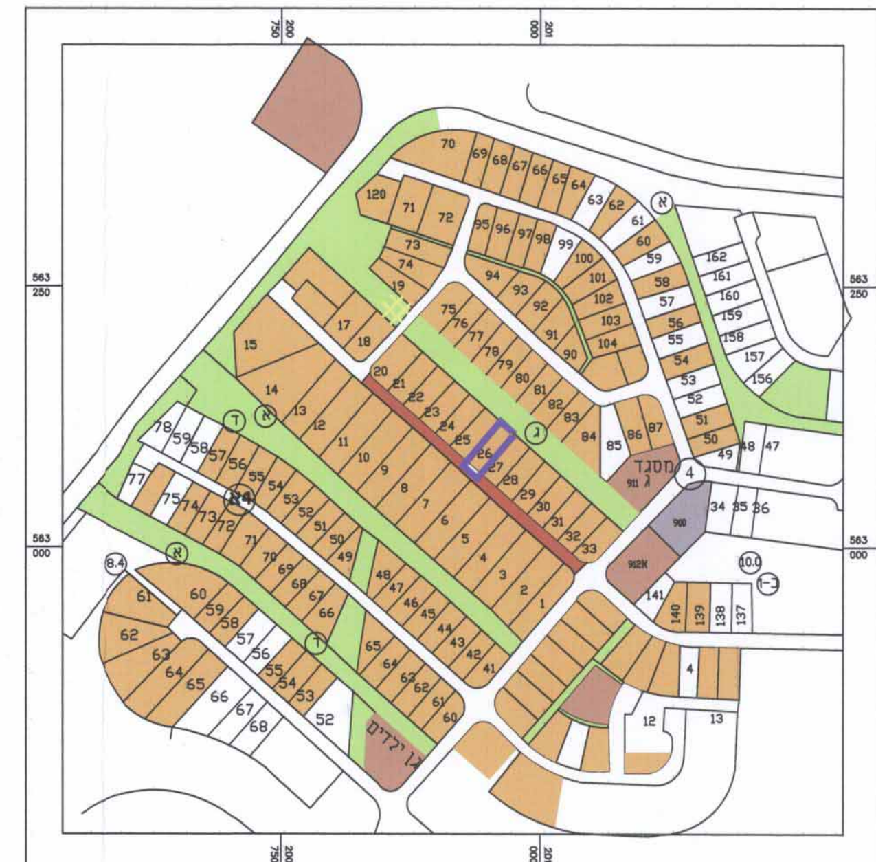
תרשים סביבה עפ"י תב"ע א/318/03/7 קנ"מ 1: 5000