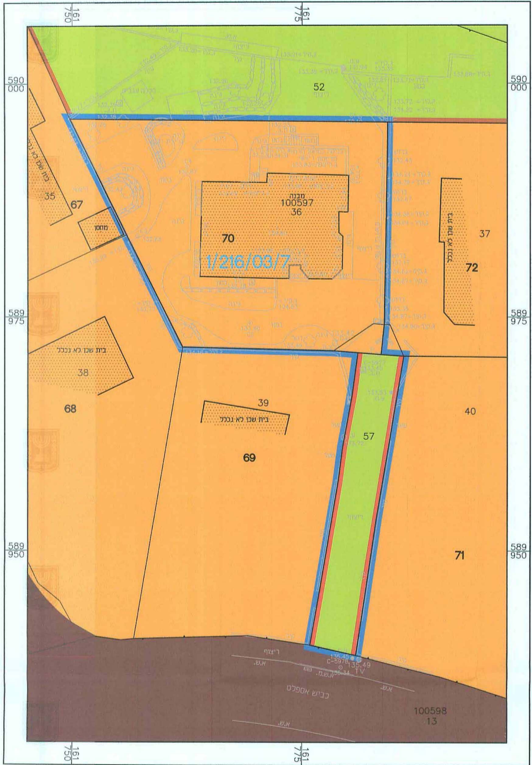
מצב מאושר קנ"מ 1:250