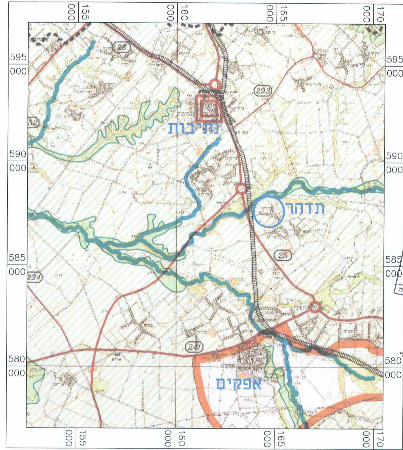
תרשים התמצאות קנ"מ 1:100,000 עפ"י תמ"א 35