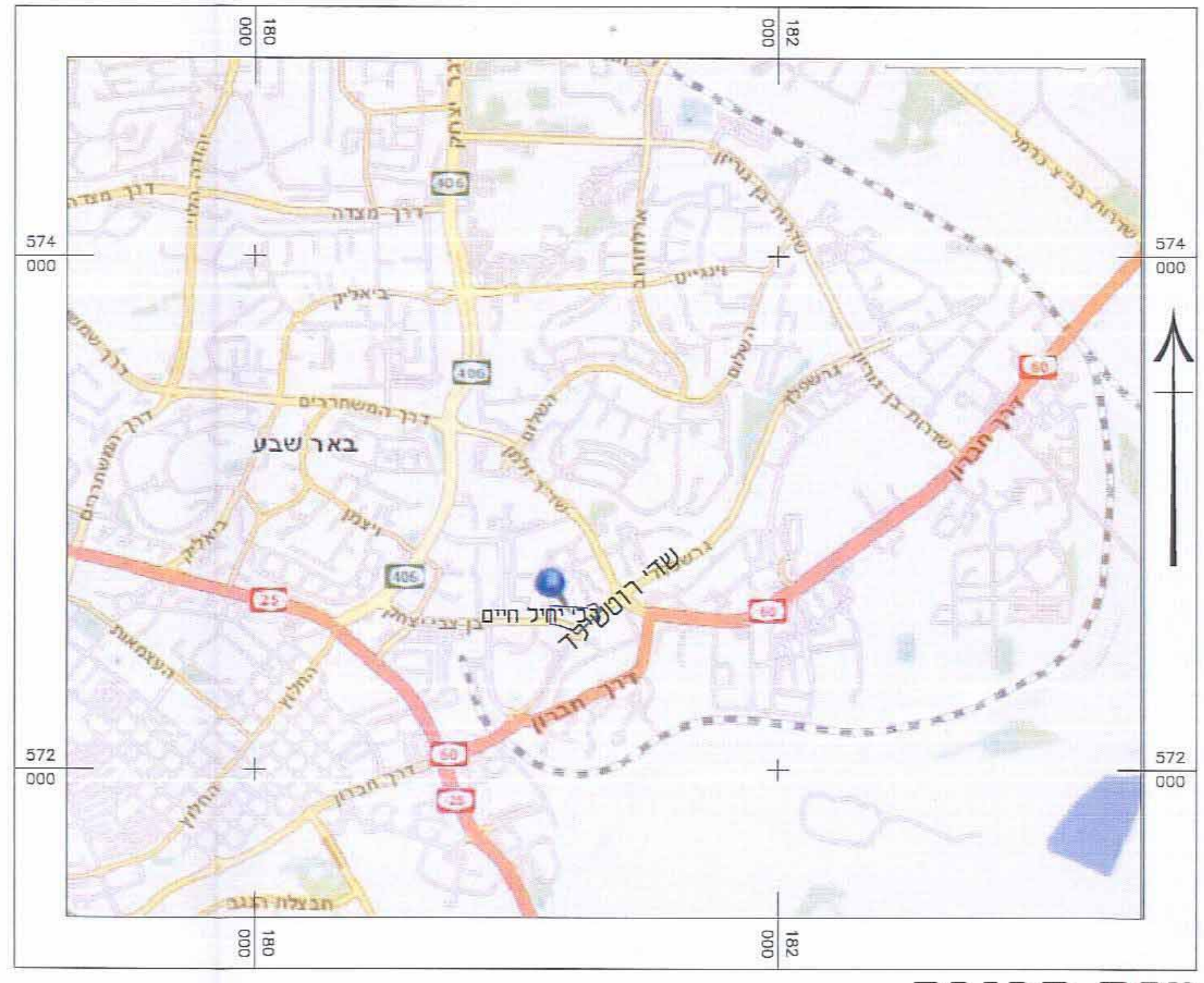
מפת סביבה 1:20,000 ק.מ.