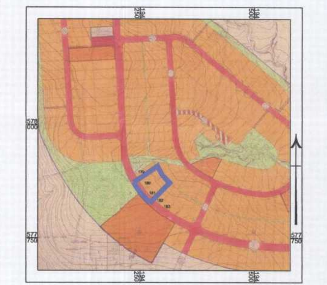
תוכנית חורה - שכונה 3 על רקע תוכנית מאושרת מס' 382/03/7 קנה מידה 1:5,000