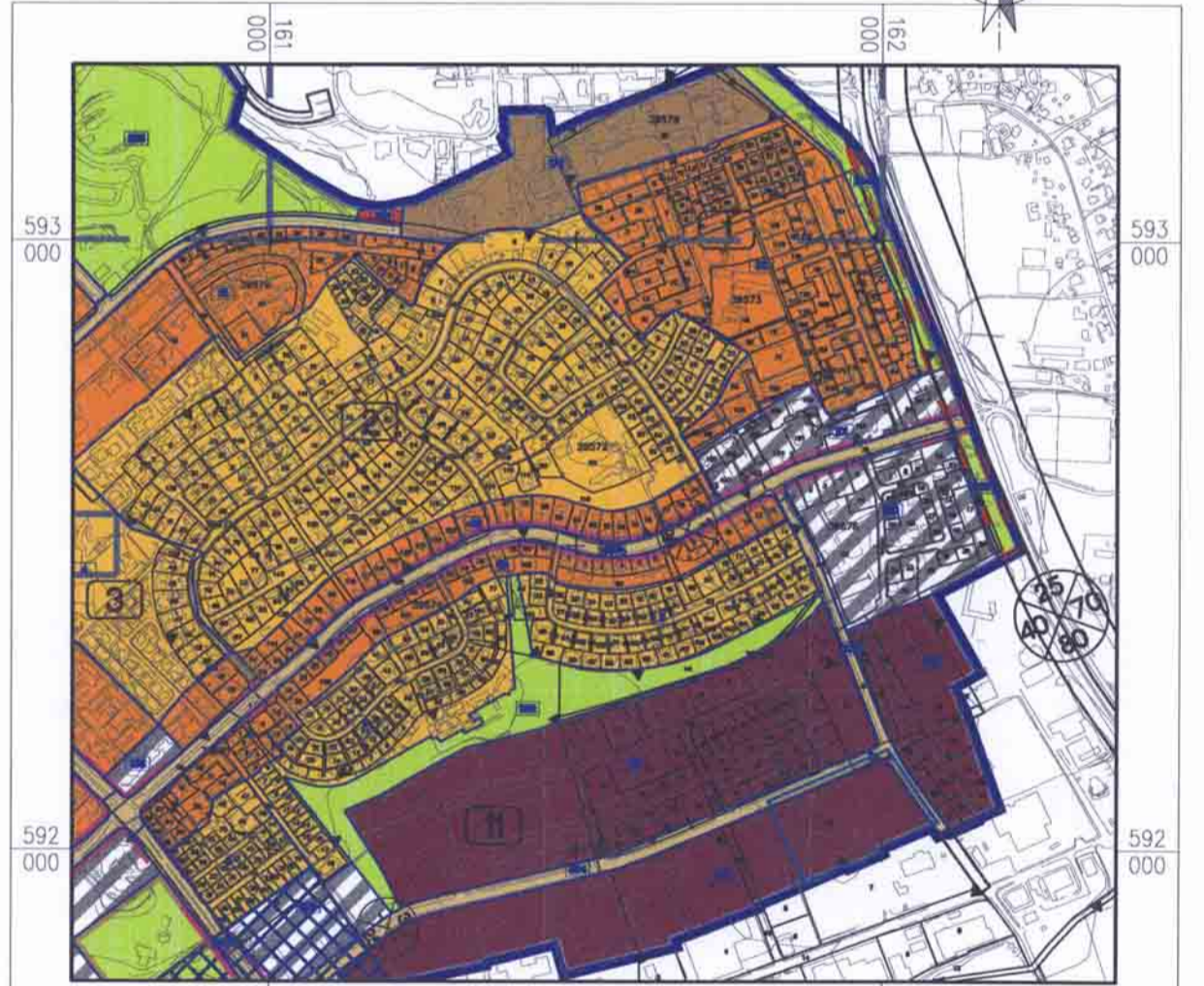
תרשים התמצאות כללית

ע"י הנכד מטיילי הנדסה והנדסה: 201100222 שירותי הנדסה