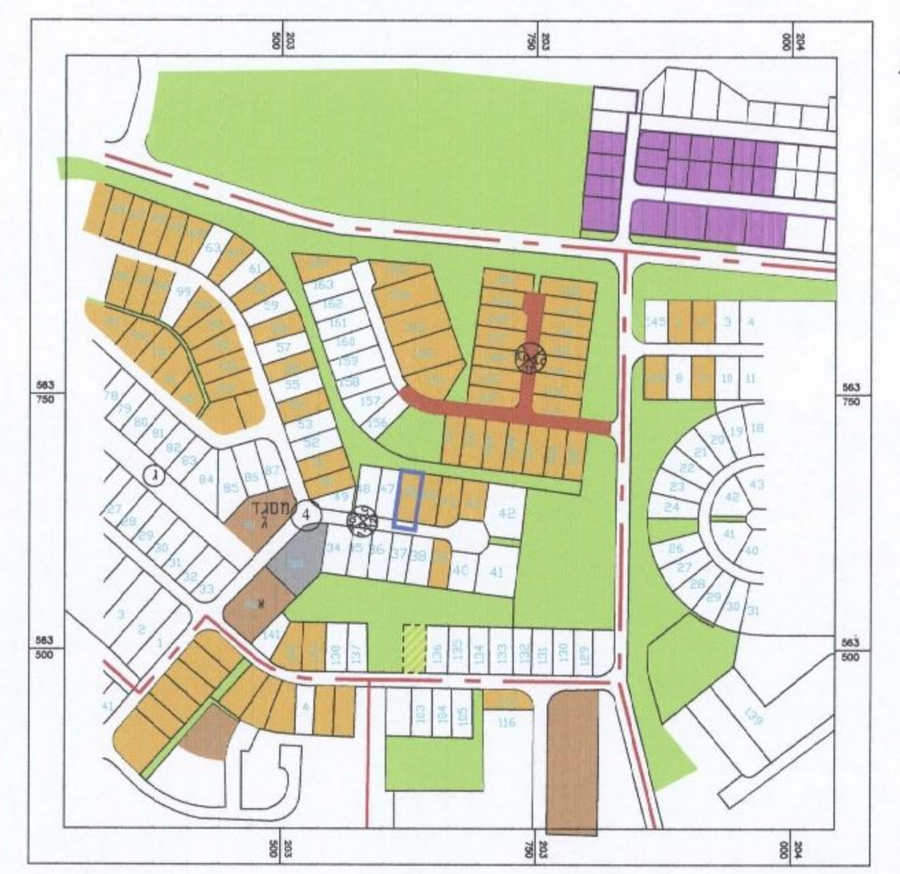
תרשים סביבה עפ"י תב"ע א/318/03/7 קנ"מ 1: 5000