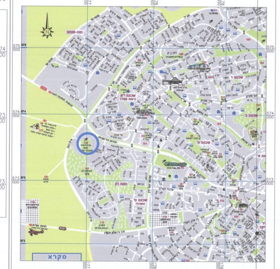
תרשים הסביבה הקרובה 1:2500