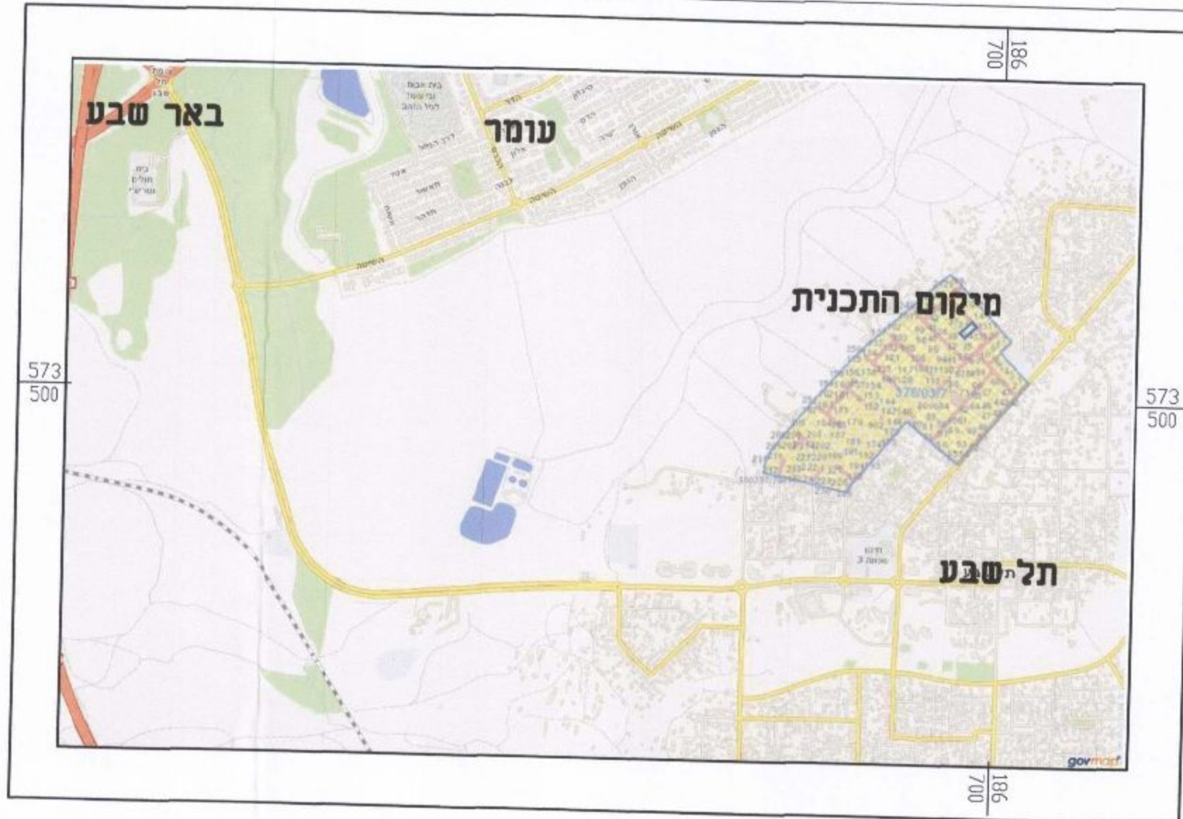
תכנית התמצאות ללא קנ"מ