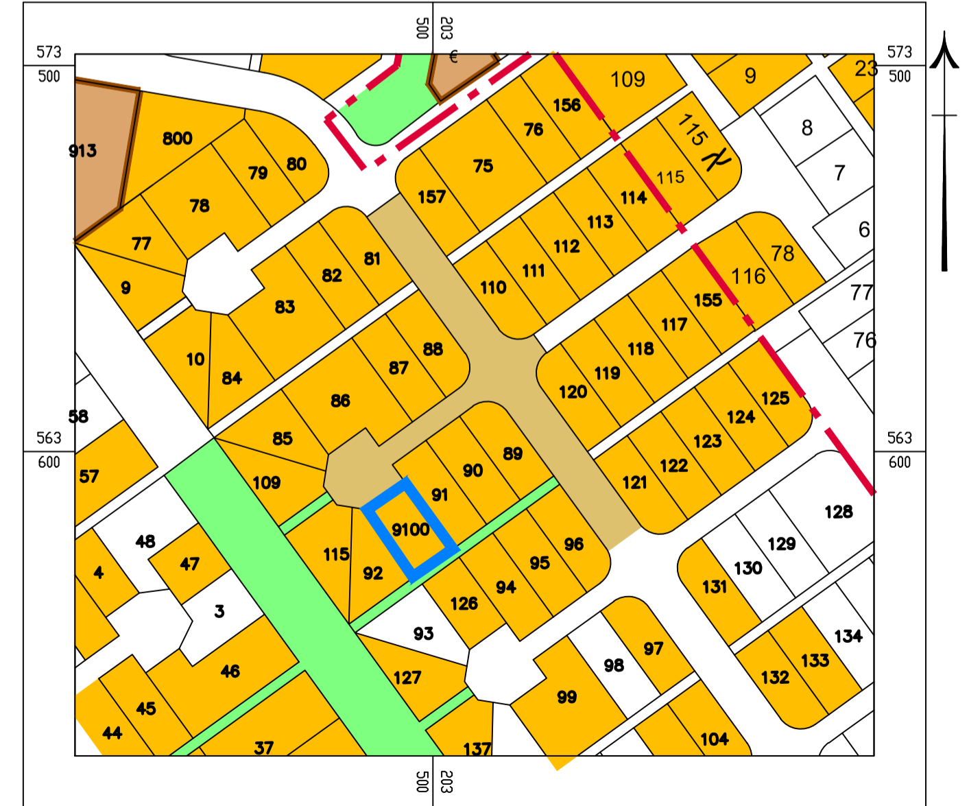
תרשים סביבה קרובה קנ"מ 1: 2500