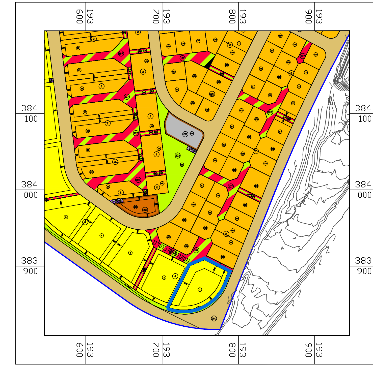
תרשים סביבה ק.מ. 1:2,500 על רקע תכניות מאושרות