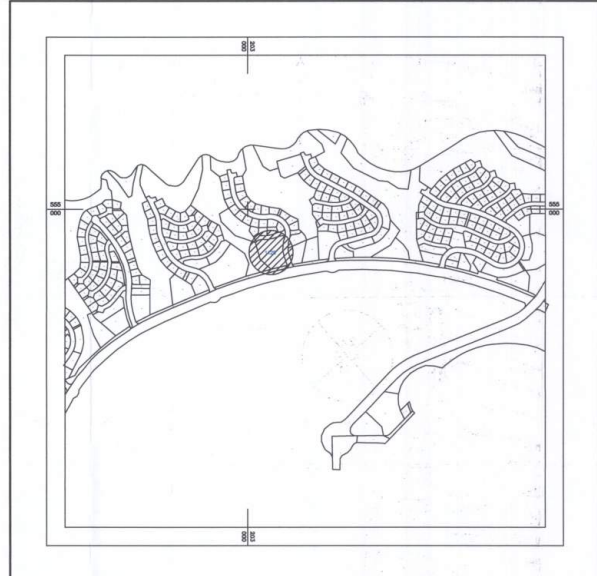
תרשים סביבה קנה מידה 1:10,000

חוק התכנון והבנייה, התשכ"ה - 1965 תכנית מפורטת