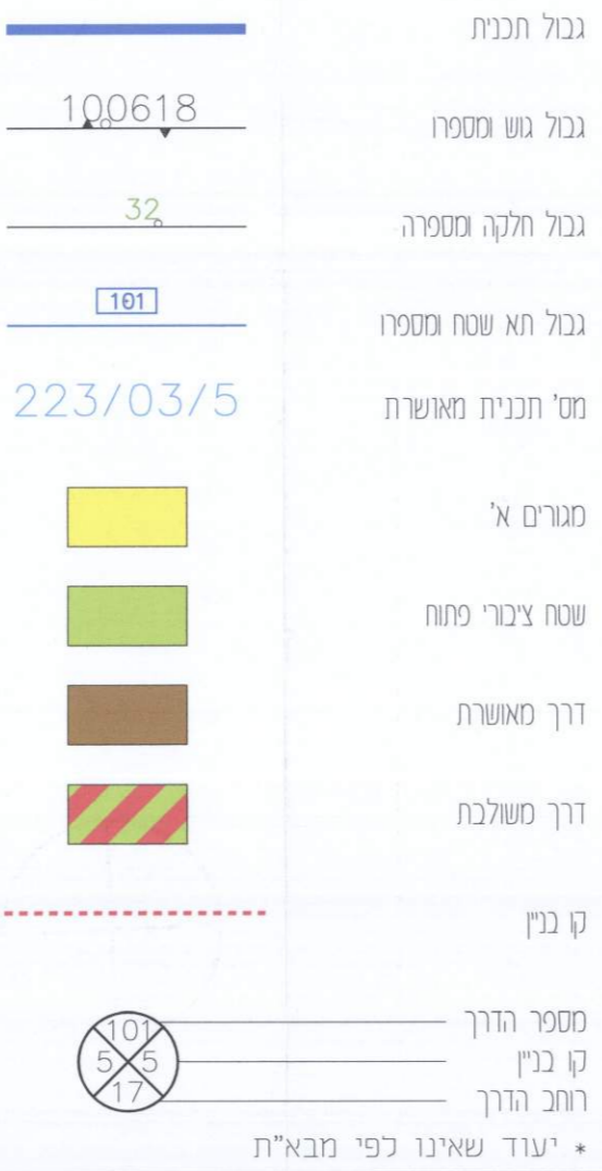
תכנית מאושרת ק.מ. 1:250