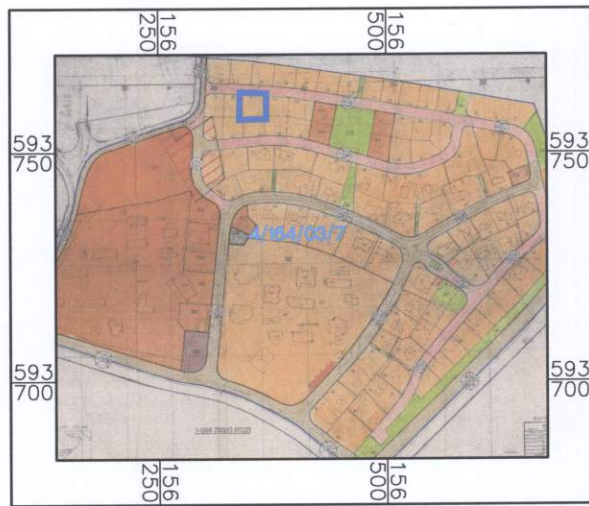
תרשים סביבה קנ"מ 1:5,000 עפ"י תביע 4\164\03\7

הועדה המקומית "נגב מערבי" אישור תכנית מס' 671-03-48565 הועדה הנ"ל הסכימה להצטרף לאושר את התכנית בישיבה מס' 2015/141