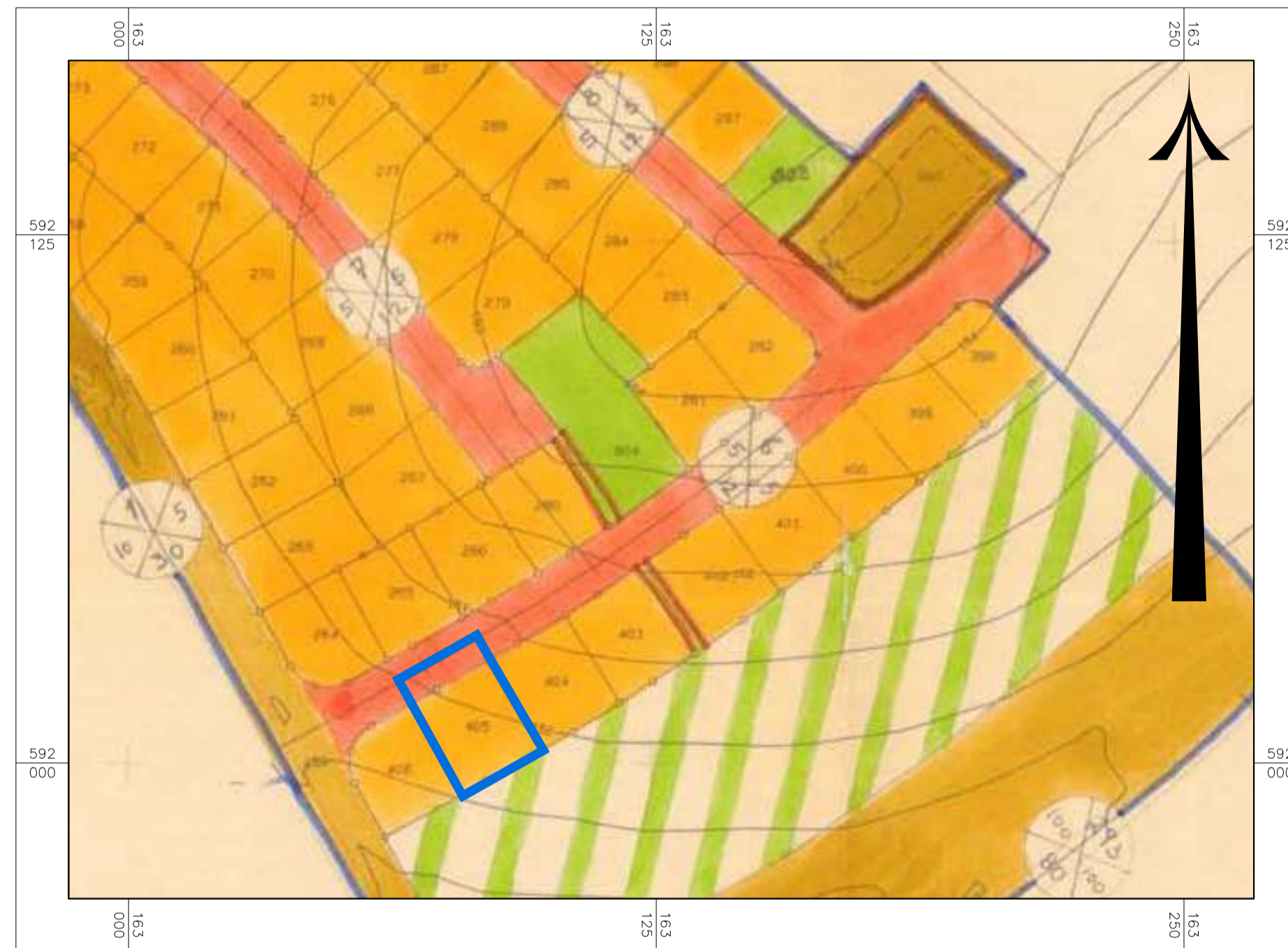
תרשים סביבה על רקע תבע 7/במ/156

חוק התכנון והבנייה, התשכ"ה - 1965 תכנית מפורטת