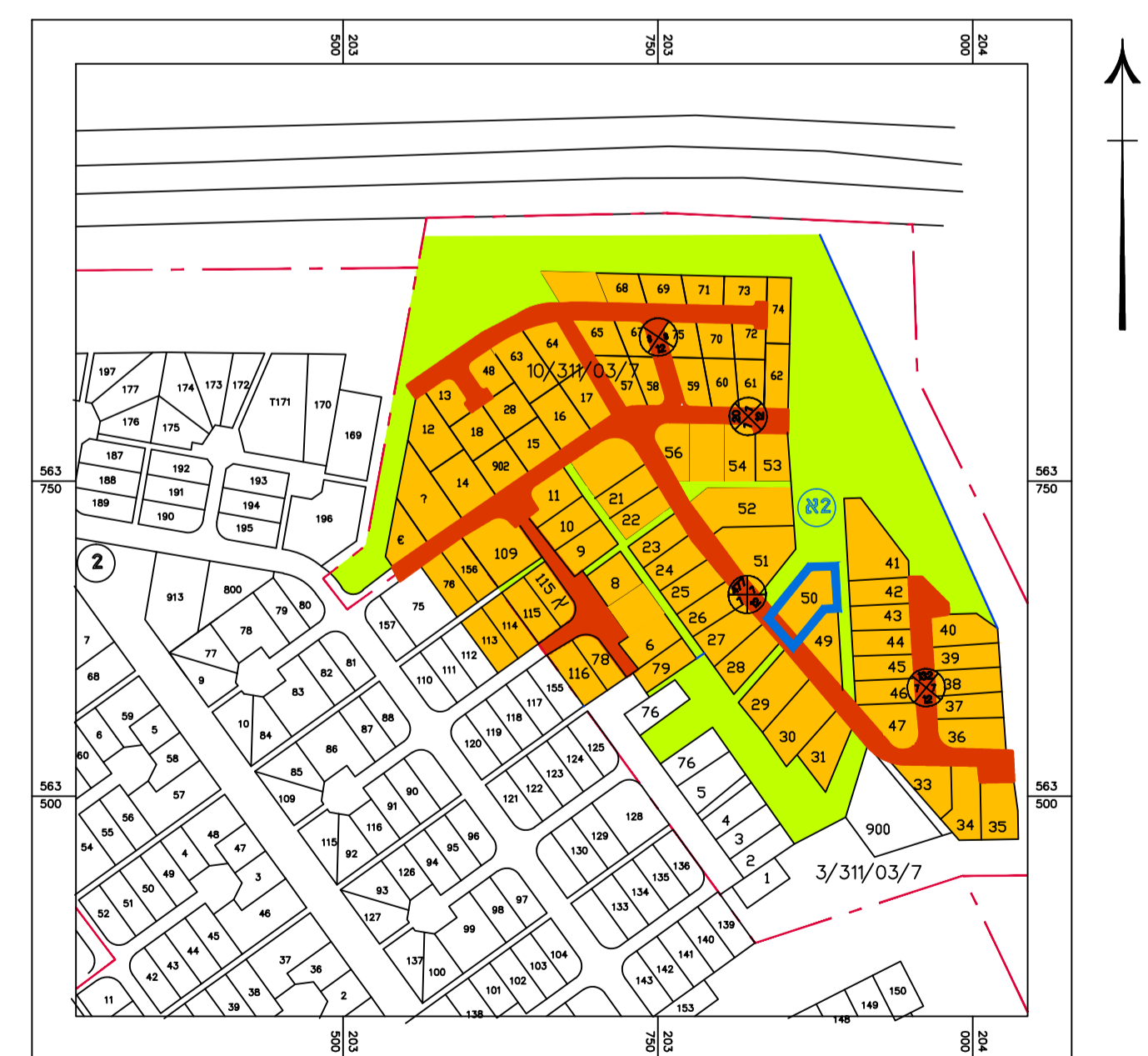
תרשים סביבה עפ"י תביע 3/311/03/7 קנים 1:5000