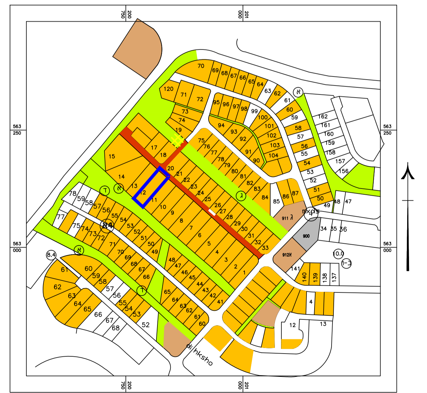
תרשים סביבה עפ"י תב"ע א/318/03/7 קנ"מ 1: 5000