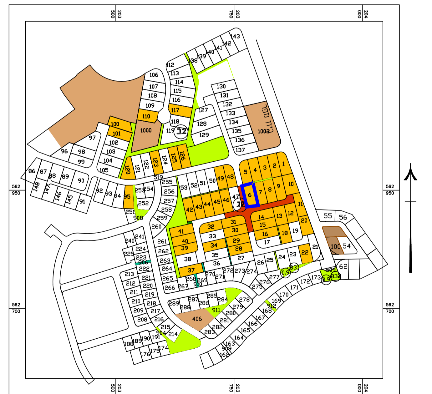
תרשים סביבה עפ"י תב"ע 2/310/02/7 ערעה בנגב קני"מ 1:5000 מקרא דרך מתוכננת (*) מגורים א (*) שטח ציבורי פתוח (*)