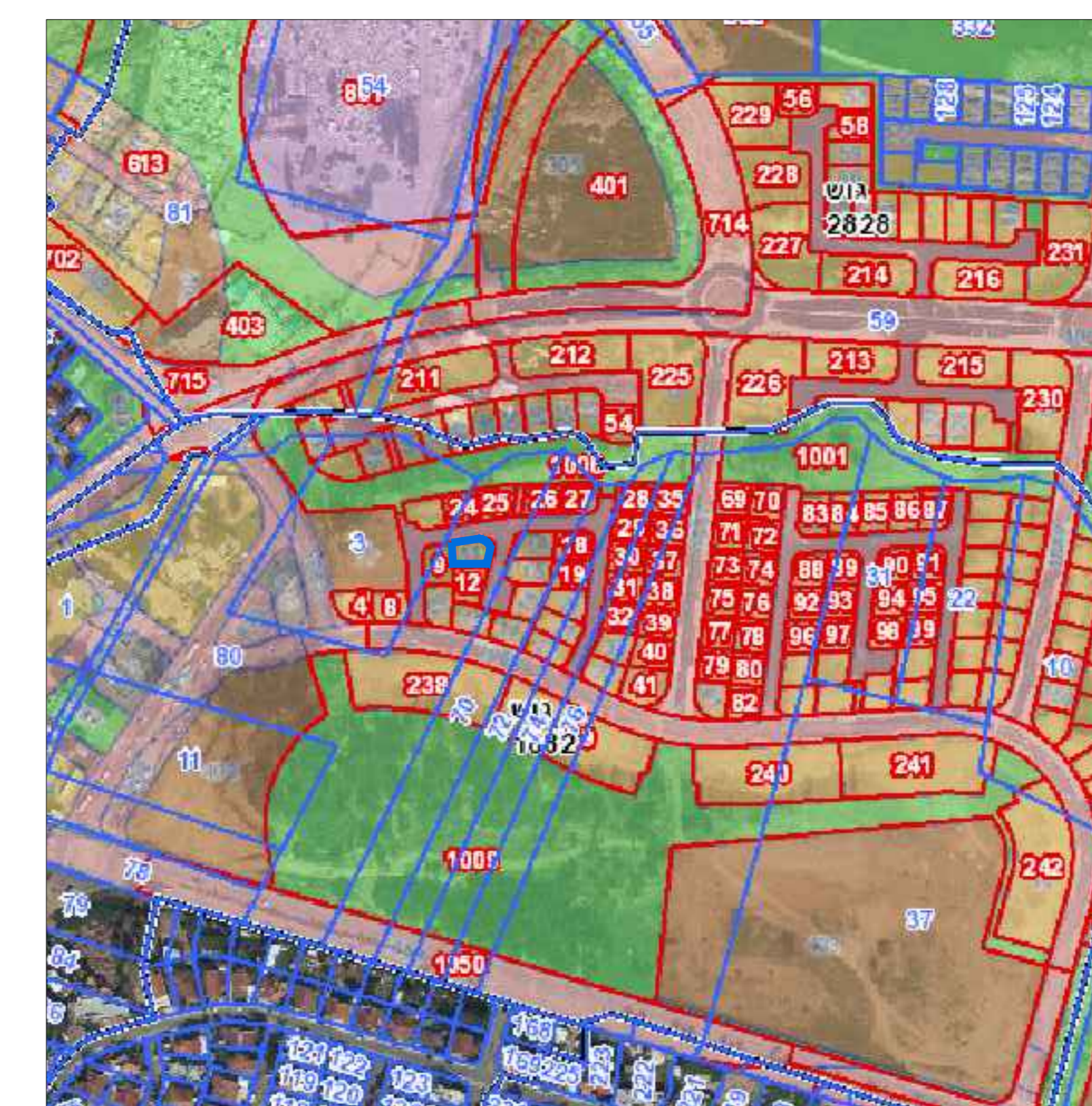
תרשים התמצאות קנ"מ 1:5000

זוהר התכנון והבנייה התשכ"ה - 1965 תכנית מפורטת