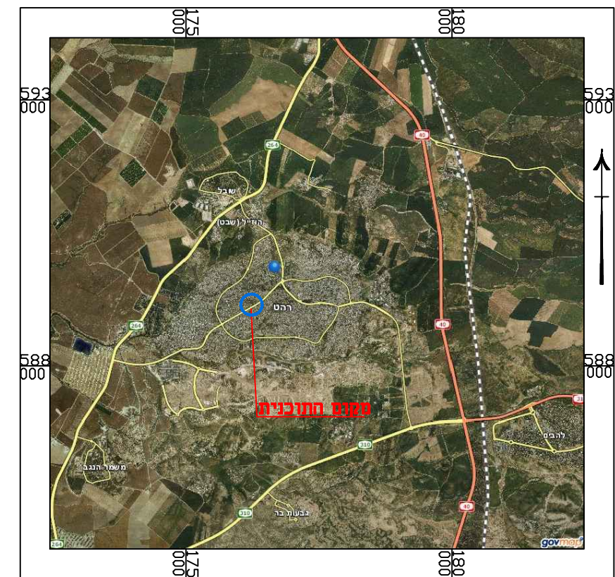
תרשים התמצאות כללית - רהט על רקע מיפוי ישראל קנה מידה - 1:100,000

מחוז: דרום מרחב תכנון מקומי: רהט רשות מקומית: עיריית רהט ישוב: רהט