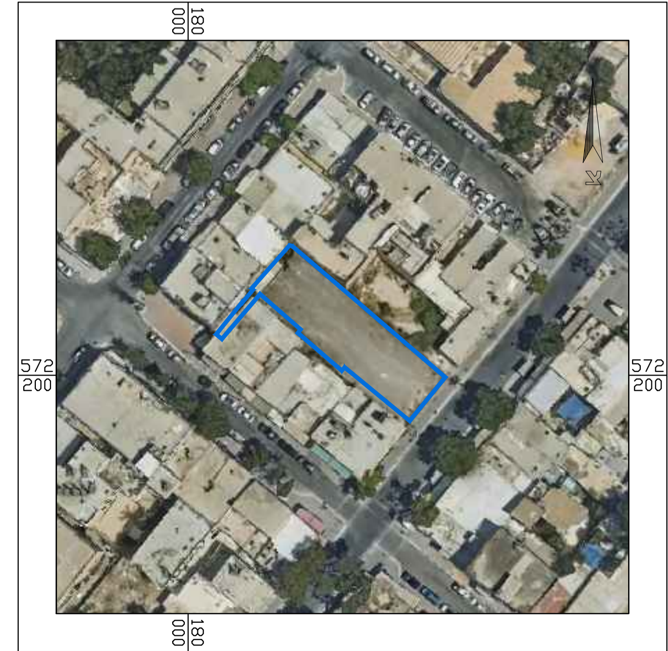
תרשים על רקע תצ"א

חוק התכנון והבנייה, התשכ"ה - 1965 תכנית מפורטת