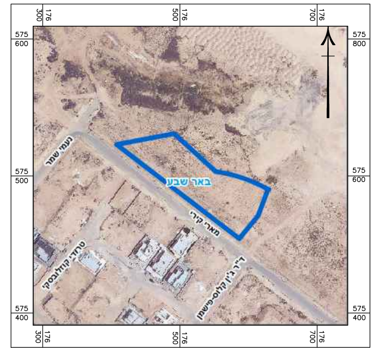
תרשים סביבה קני"מ 1:2000