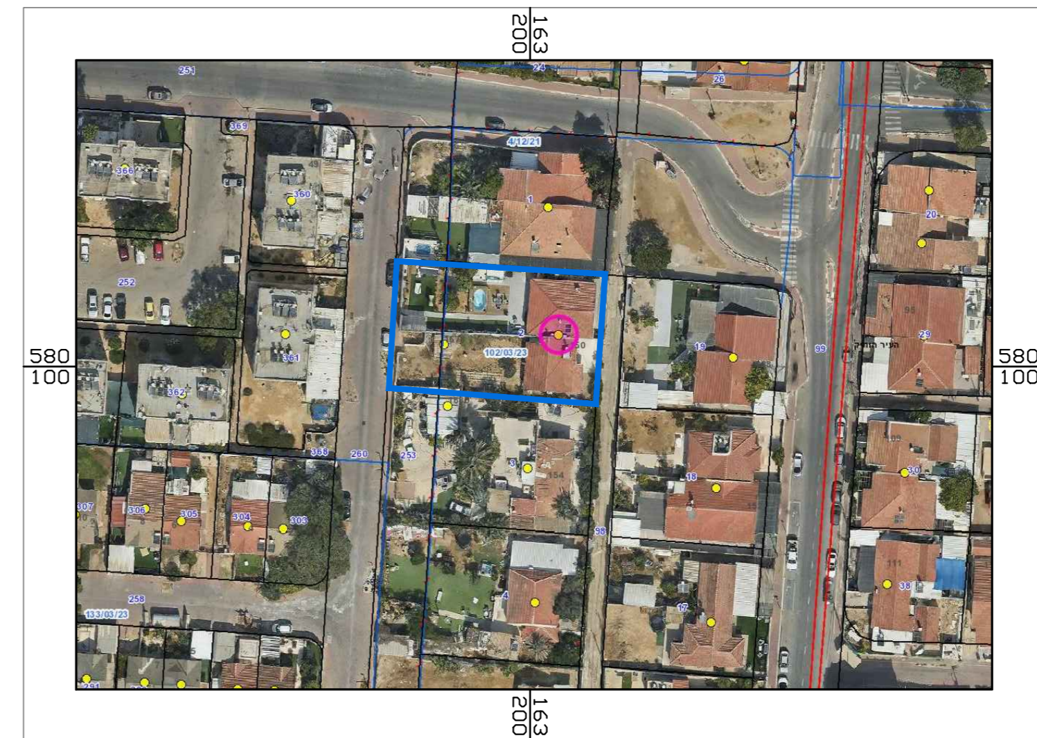
תרשים סביבה אורתופוטו 2021 ק.מ. 1:1000