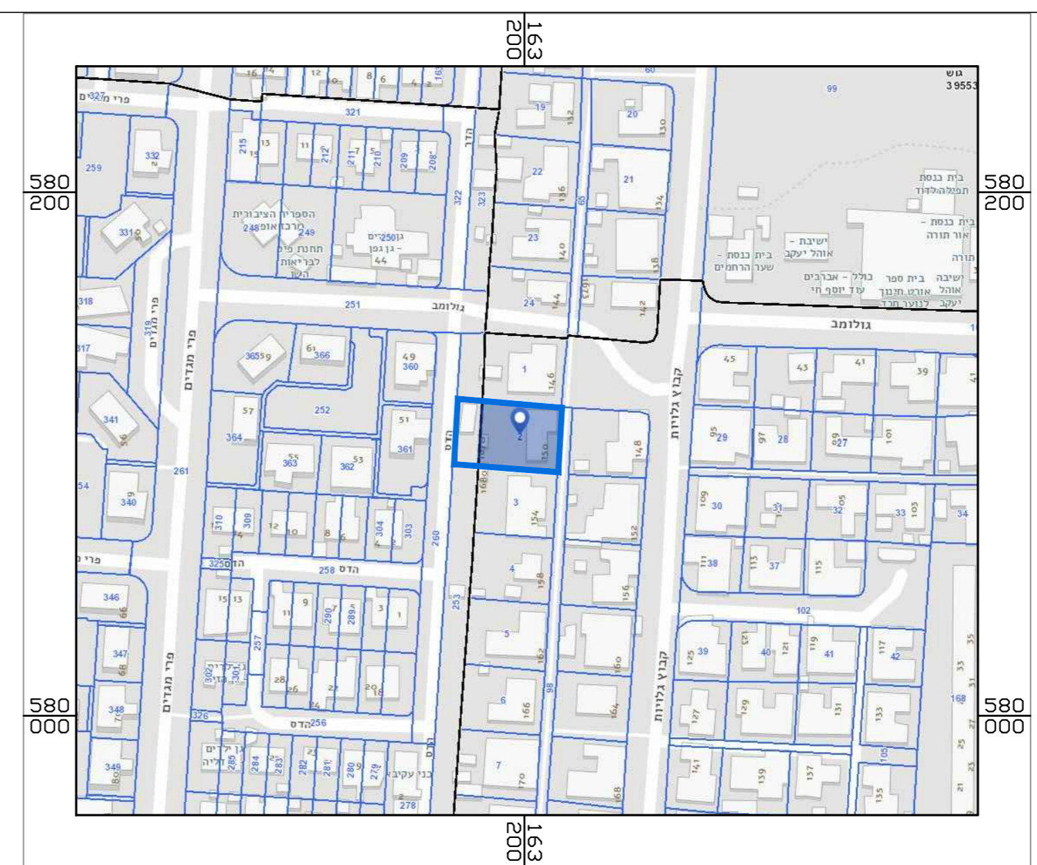
תרשים סביבה ק.מ. 1:2000