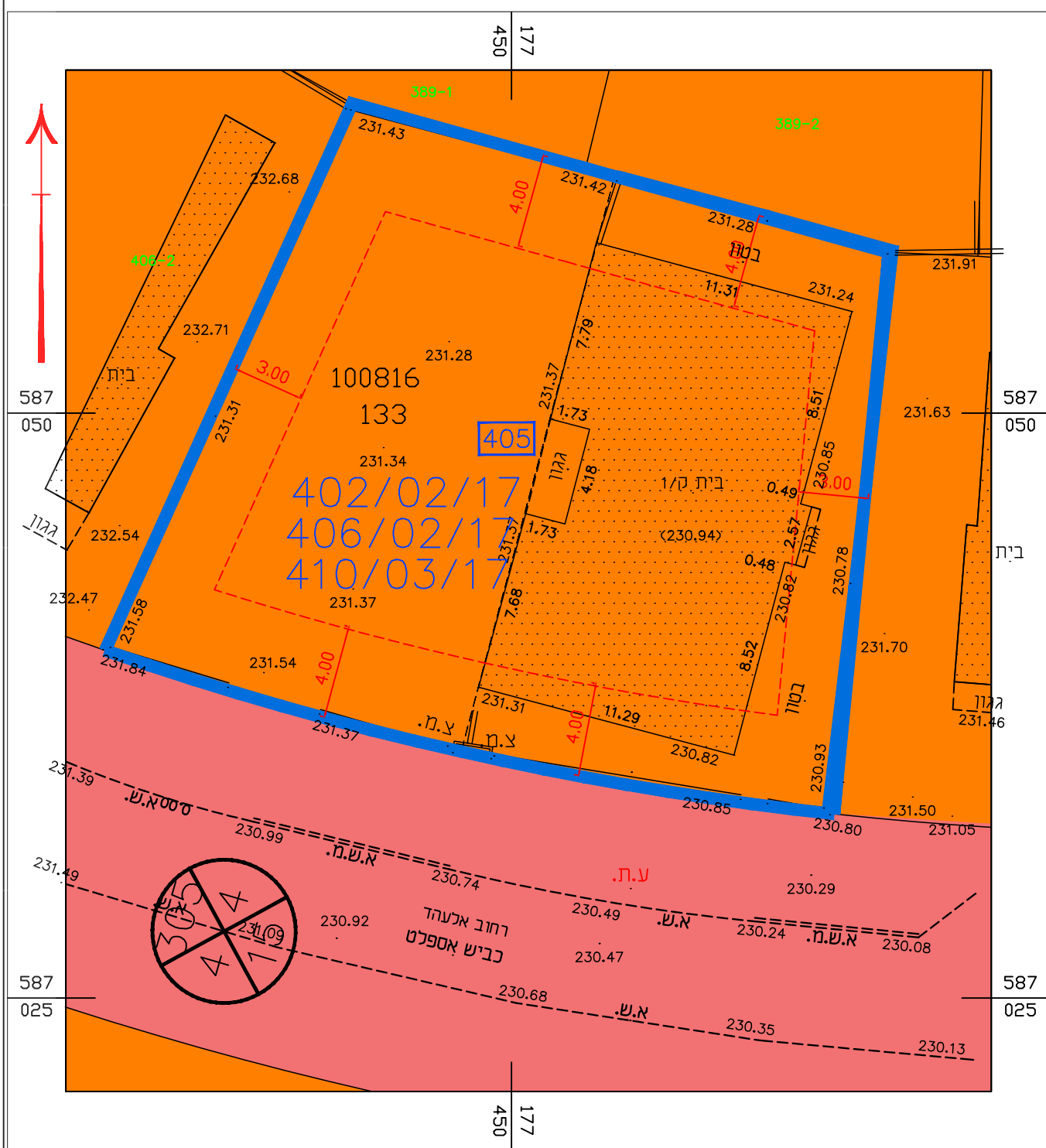
תרשים מצב מאושר קני"מ 1:250

חוק התכנון והבניה, התשכ"ה - 1965 תכנית מתאר מקומית