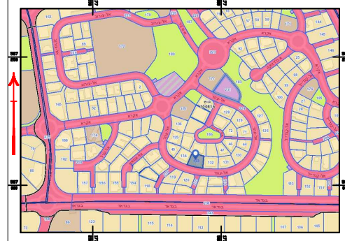
תרשים סביבה על רקע תשרים 17/03/410 קני"מ 1:2500