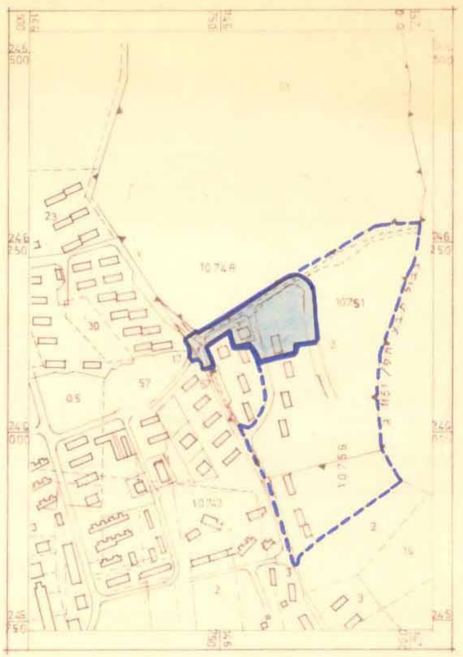
תחשיים הטבי'בה 1:50000