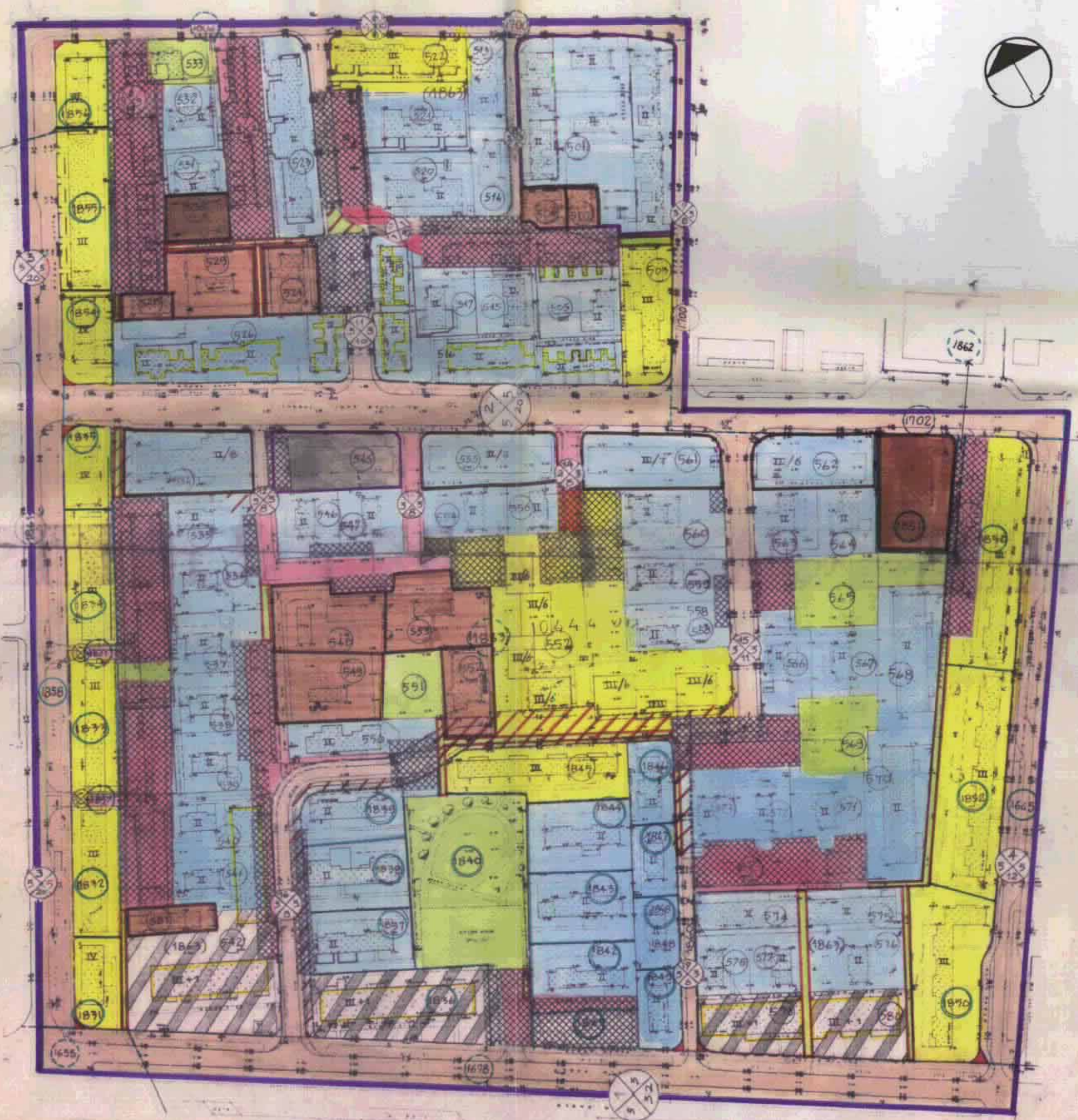
תשריט מוצע 1:1250