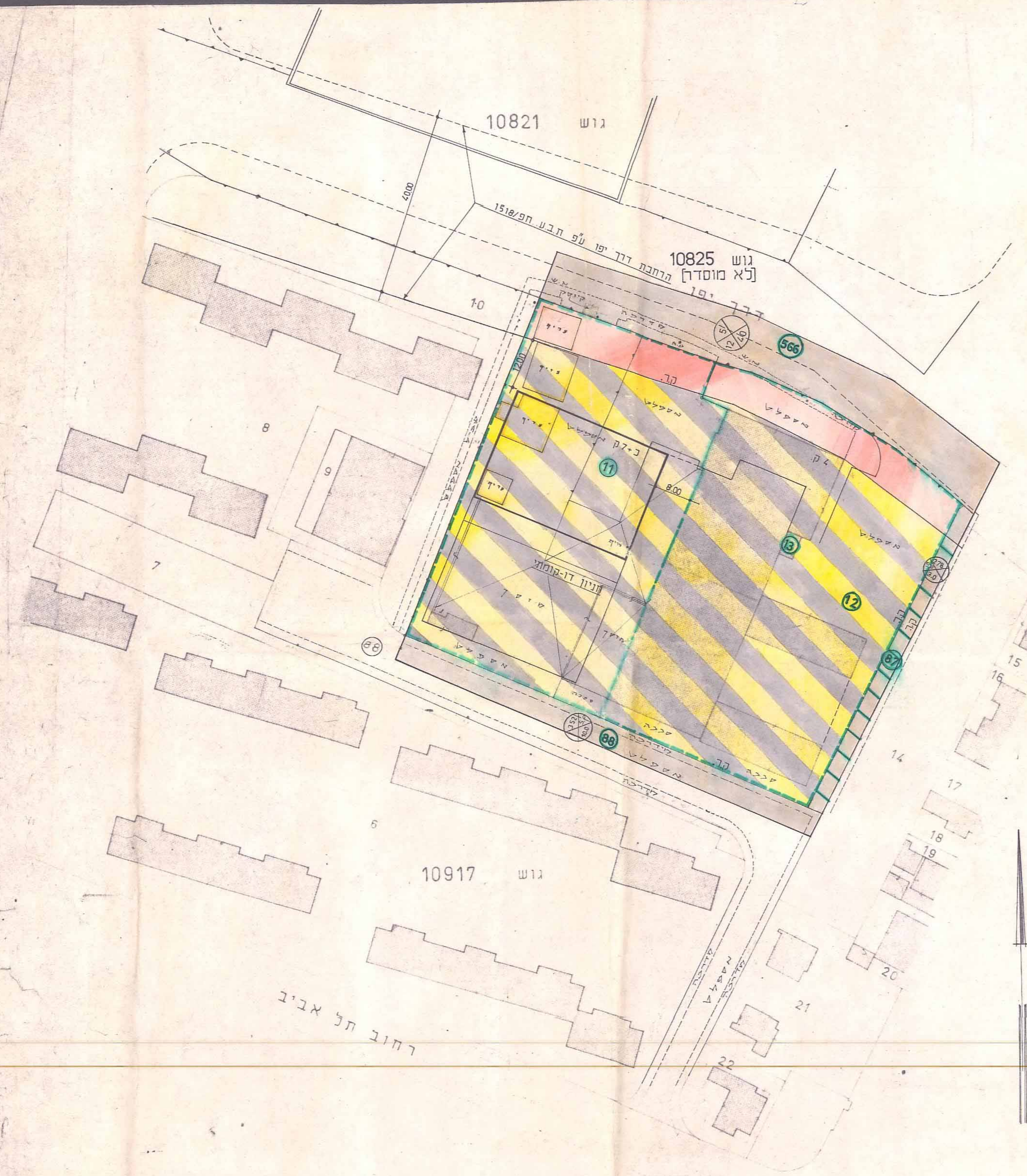
תכנית קנ"מ 1:500

תכנית זו שורטטה על רקע הקטנה של תכנית מורד מוסמך מיום 6.8.1979 מחוז פינוספי חיפה