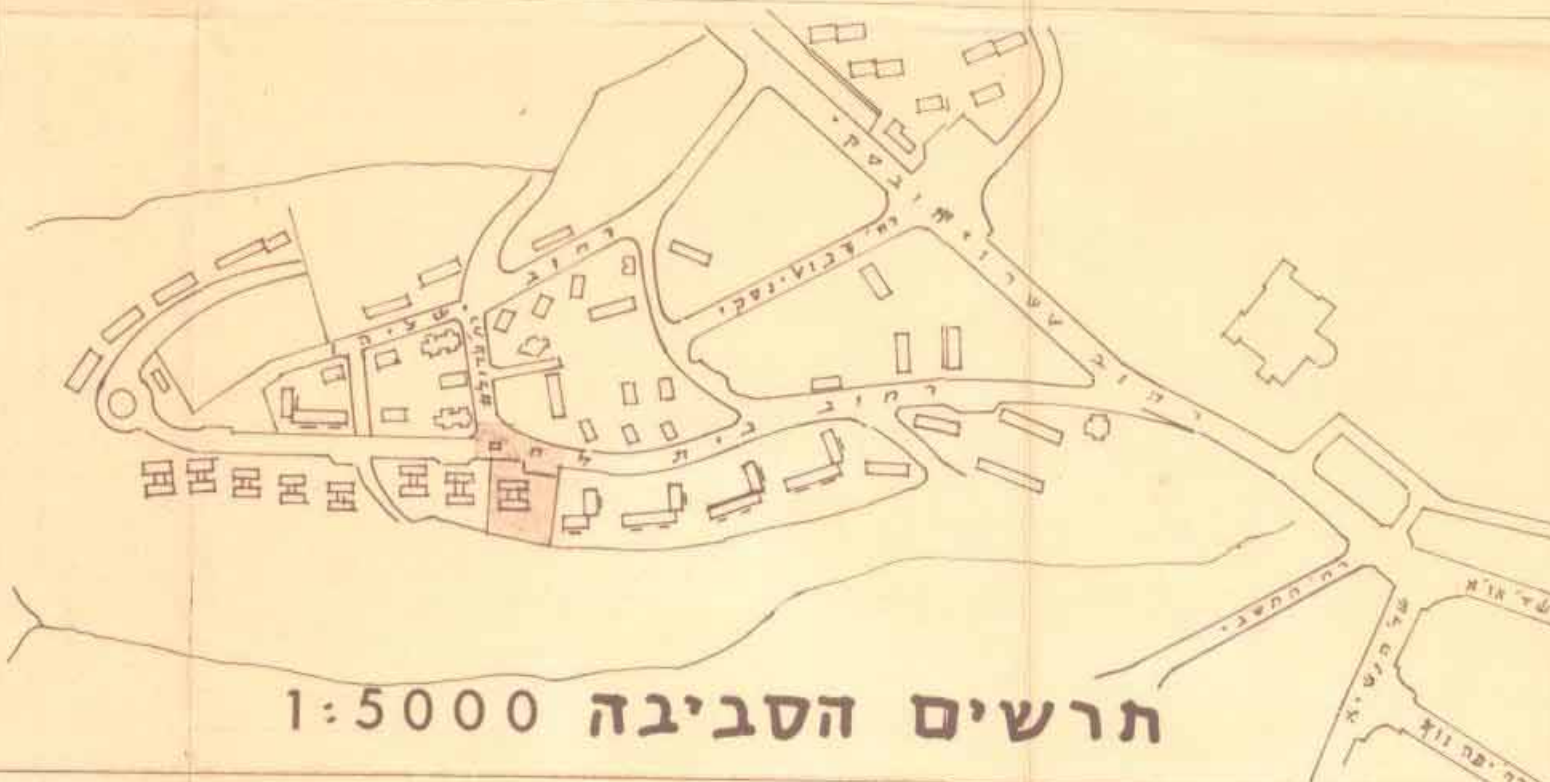
תרשים הסביבה 1:5000

מכון עובדי הערים מ. יונתוב מורה מושק 24 חרף 1969 מכון עובדי הערים מ. יונתוב מורה מושק