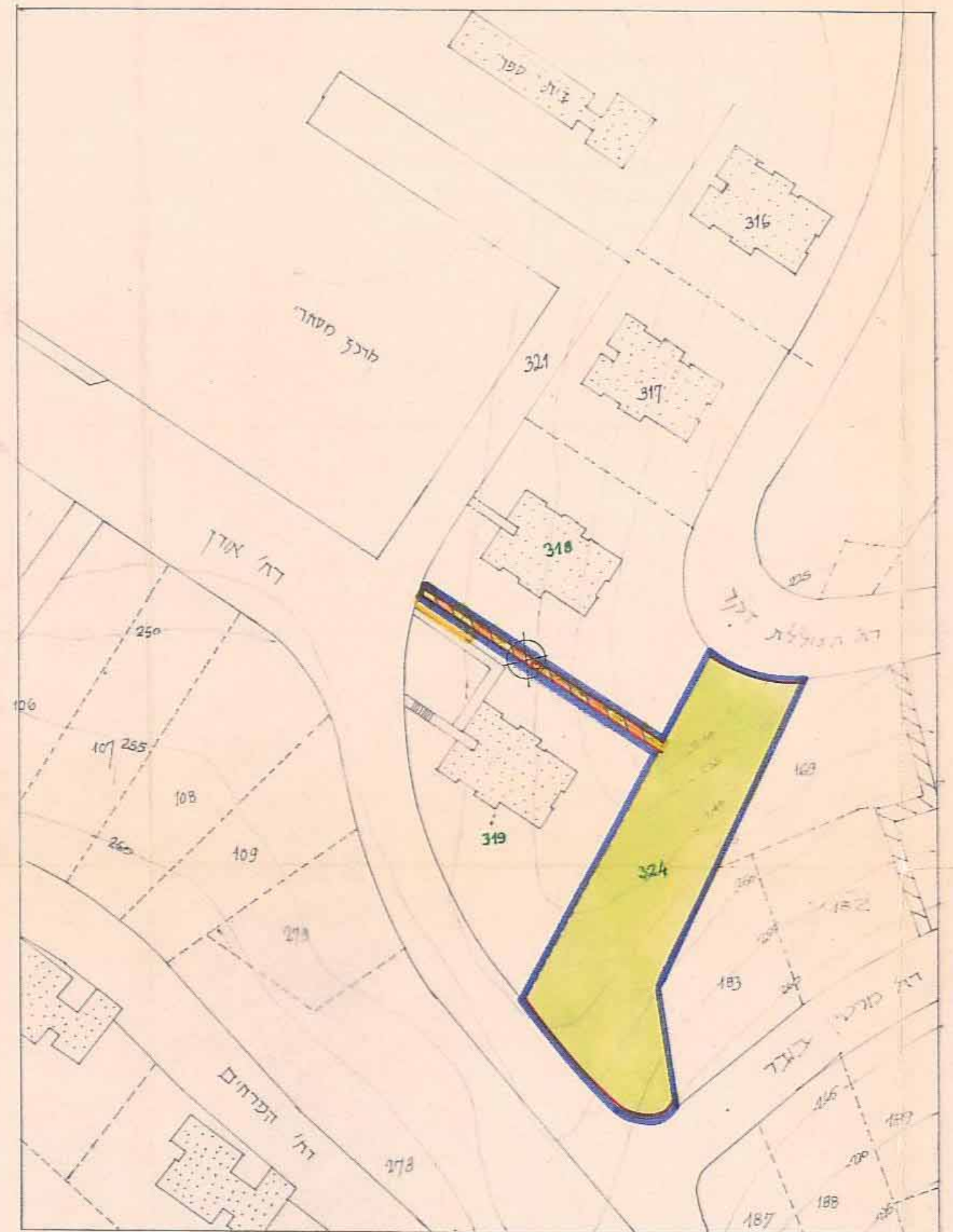
מצב מוצע 1:1250 ק.מ.