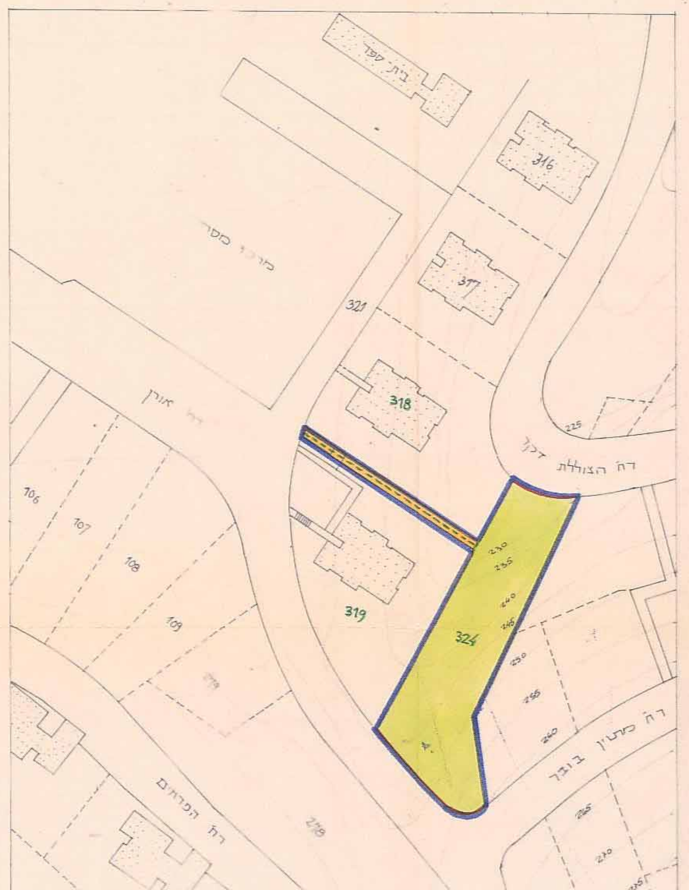
מצב מאושר 1:1250 ק.מ.