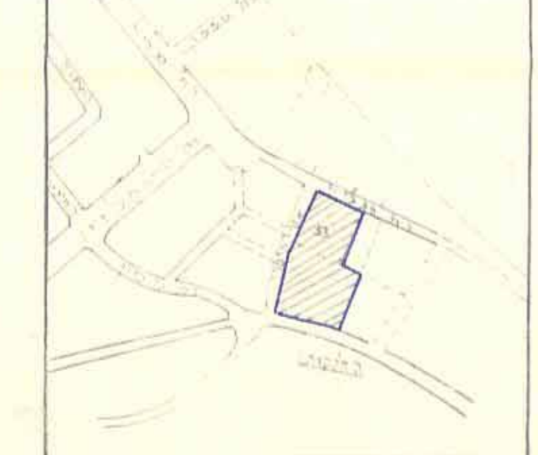
תשריט סביבה ק.מ. 1:5000