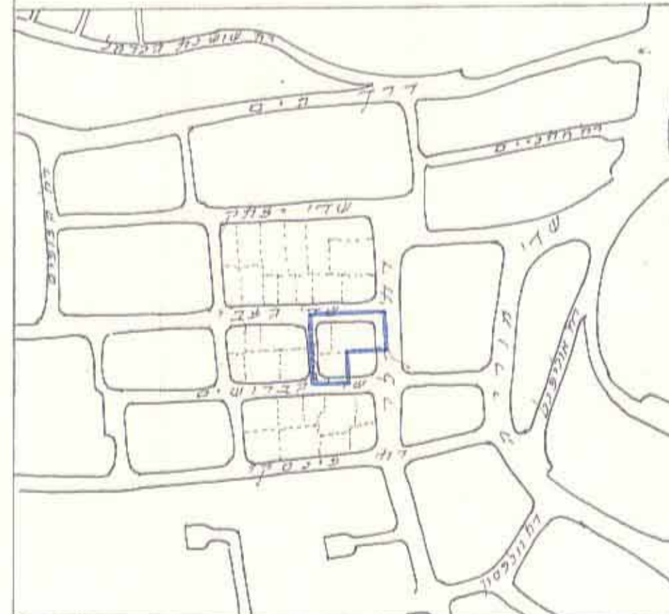
תרשים המקום - 1:5000