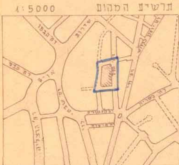
שטח התכנית : 2.6 דונם בערך

עיריית חיפה משרד הפנים המחלקה לבניה ולתכנון העיר תשריית מצורף לתכנית תכנון עיר מס' חפ/1170 אתר לגן ילדים ברחוב חדר ק.מ. 1:250 מס' חפ/1170 822 /ת 1962.11.10