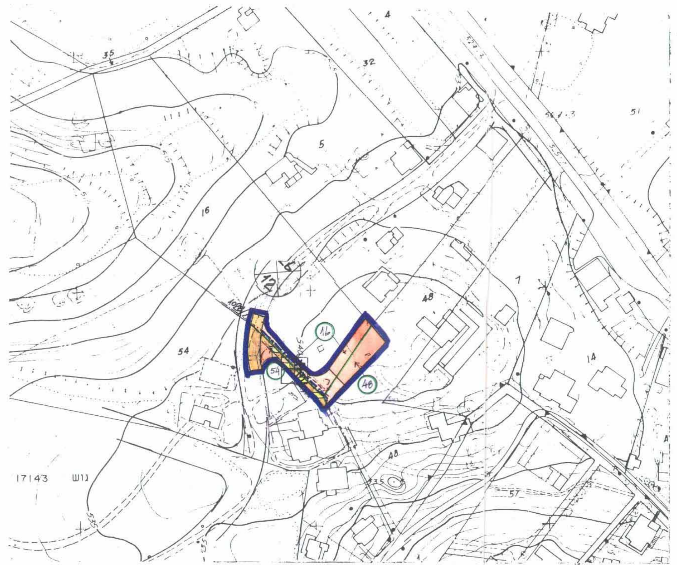
כצב קיים 1:1250