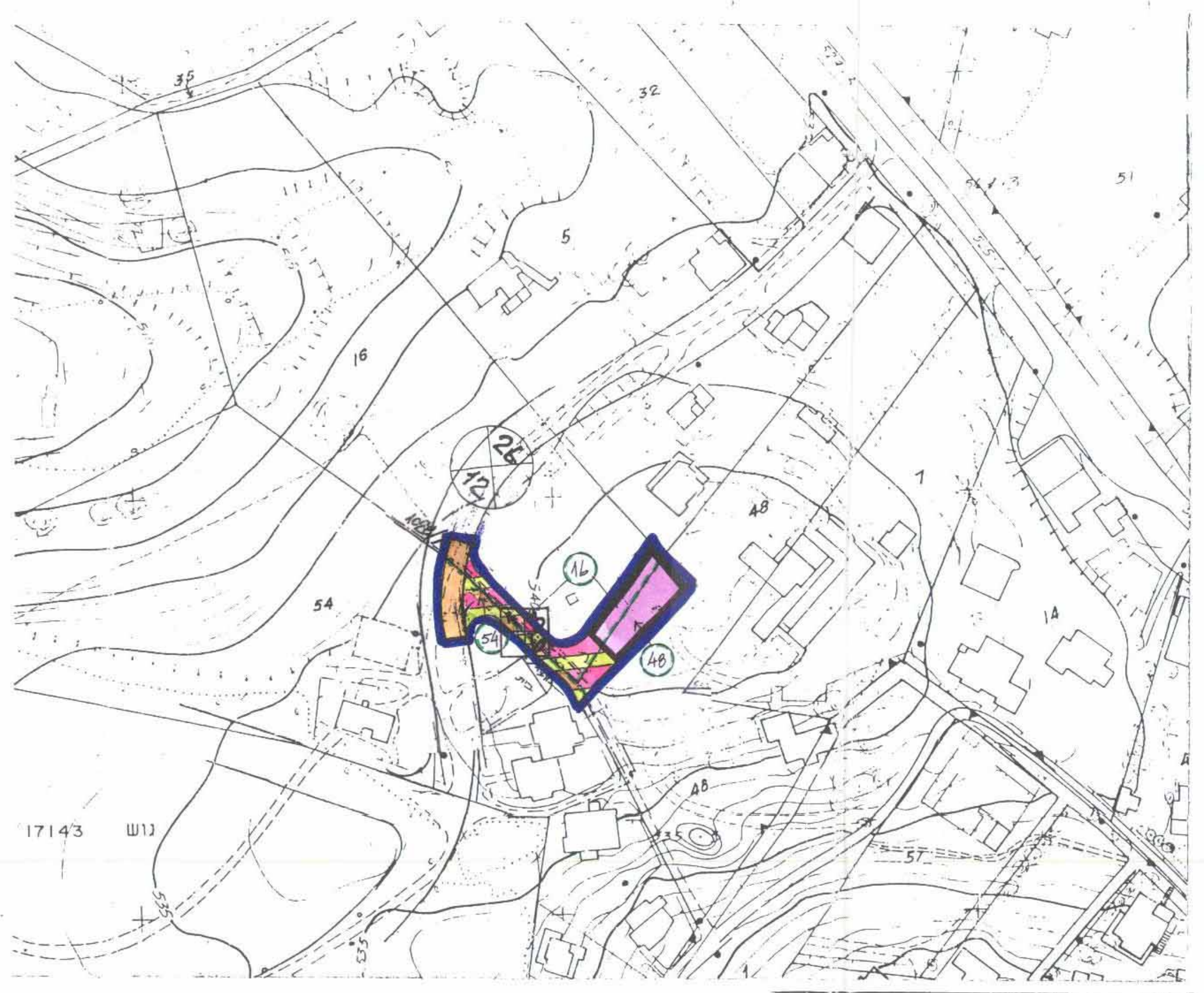
כצב כתוכנן 1:1250