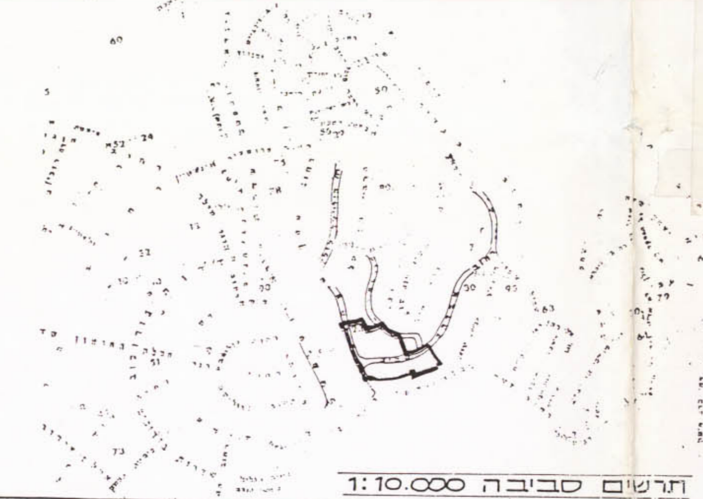
תרשים סביבה 1:10.000

נאצב מאושר ערפי תכנית כ/84 ותרט' 2/47/15 ק.מ. 1:1250