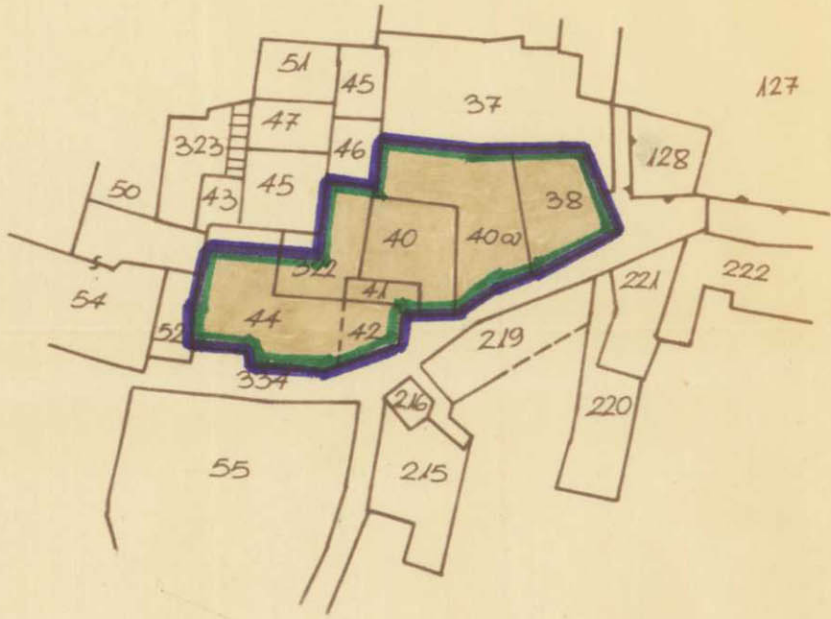
מוצע ק.מ. 1:625

חלקות - 38, 40, 41, 42 וחלק מחלקות 44, 322.