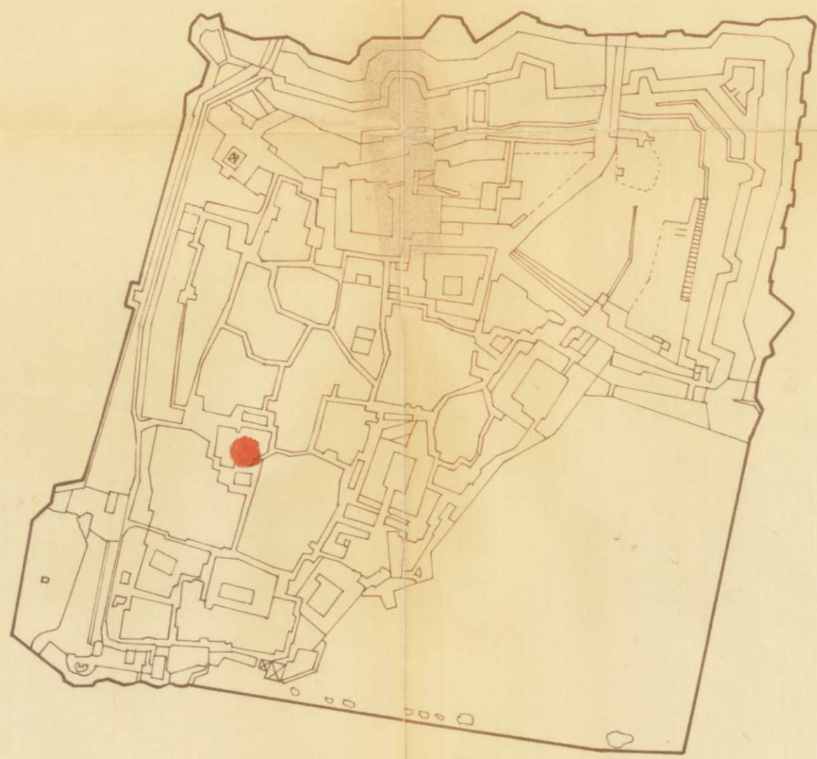
תכנית הסביבה ק.מ. 1:5000

היוזם ומגיש התכנית : שרת עפ"י בעלי הקרקע : מחבר התכנית :