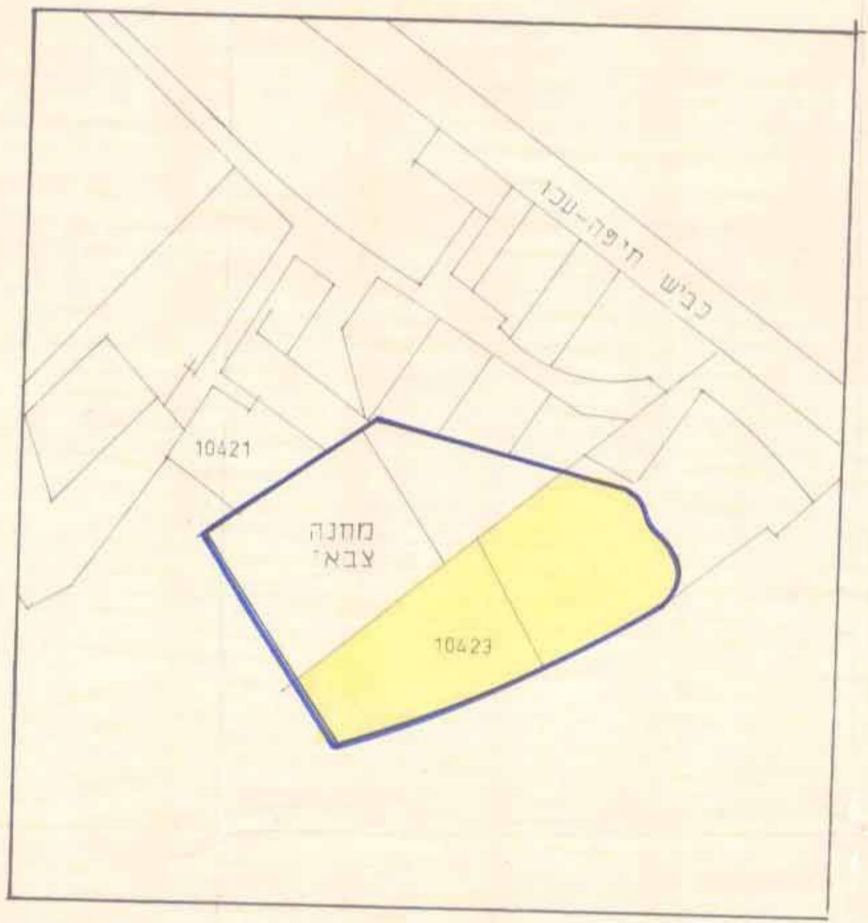
מצב קיים 1:5000