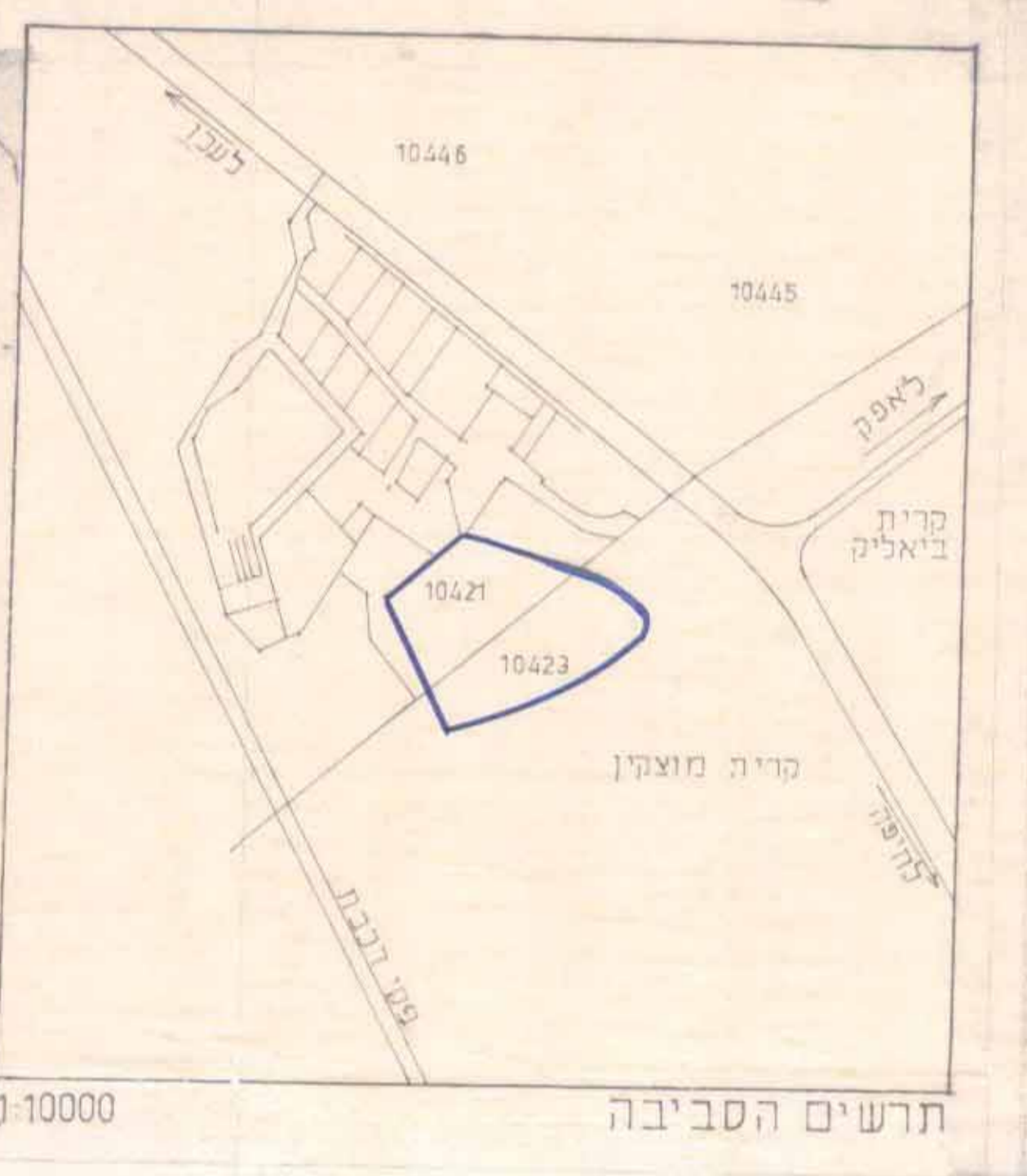
תרשים הסביבה 1:10000